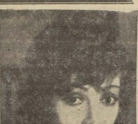
Lya de Putti'nin en son resimlerinden biri

Sonra sinema bir az da talih işidir. Çok artistler vardır ki, bugünkü mevkilerini tesadüf denilen talih-