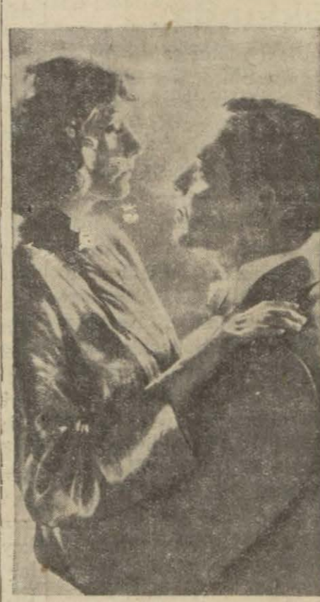
Greta en son filminde Clark Gable ile beraber

Amerikan gazeteleri, hermedense daima mütezat haberler vermekten zevk alıyolar. Bir gün, bakıyoruz, filân yıldız izdivaç hayatından son derece memnundur. Ertesi gün talâk davası acamak isteyormuş. Daha ertesi gün kocası ile ondan iyi geçinen yokmuş.