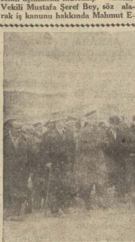
Şükrü Kaya Bey Mardinde Kendisini teşyi edenlerin ellerini sıkıyor.