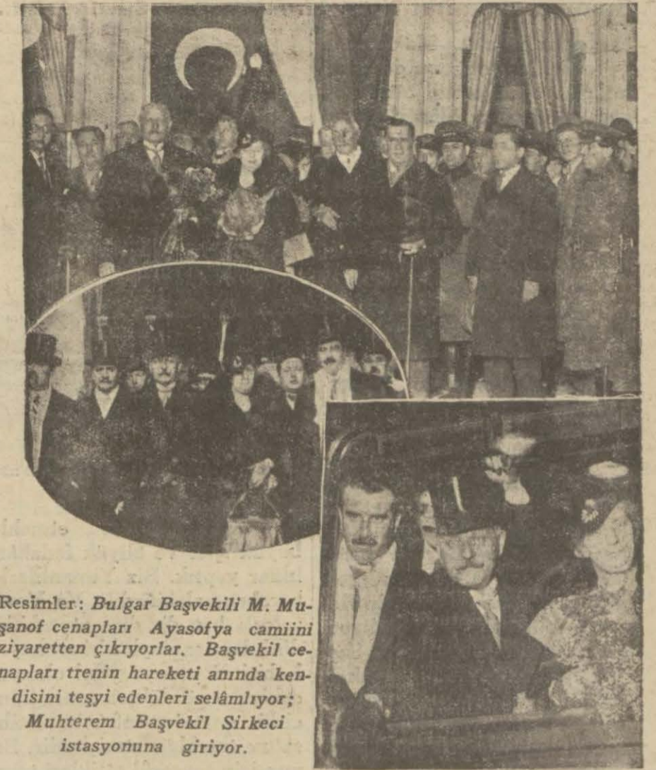
Resimler: Bulgar Başvekilî M. Muşanof cenapları Ayasofya camiini ziyaretten çıkıyorlar. Başvekilî cenapları trenin hareketi anında kendisini teşyi edenleri selâmlıyor; Muhterem Başvekilî Sirkeci istasyonuna giriyor.

— Bankamızın gayrimübadil bonoları satın aldığı doğru değildir. Bunu teklip edebilirsin.