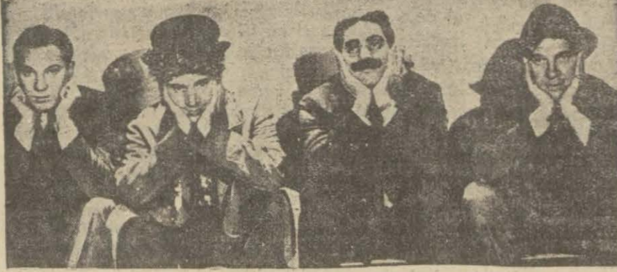
Stüdyoda sıralarını bekleyen dört figüran

Işık nasıl kelebekleri çekerse, stüdyo kapıları da mutlaka sinemaya intisap etmeğe karar vermiş gençleri de öyle çekiyor. Kim bilir yer yüzünde ne kadar genç kız ve delikanlı vardır ki, en büyük arzuları si nema artisti olmaktır.