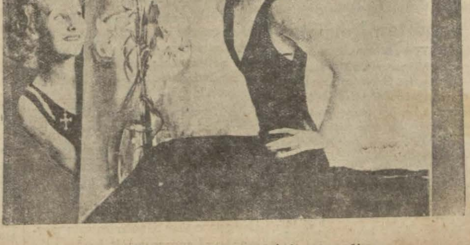
Lilian Harvey kendi resmini seyrediyor