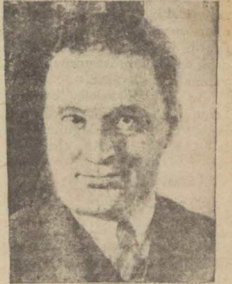
Yeni Ziraat Vekili Muhlis Bey

ANKARA, 30 (Telefon) — Ziraat Vekili Muhlis Bey sabah leyin, Gümrük ve Inhisarlar ve kili Rana Bey de öğleden sonra (Devamı 6 nci sahifede)