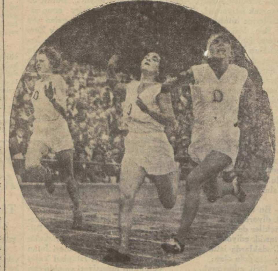
Los Angeles olimpiyadına iştirak edecek olan Alman kadın yüz- metrecileri antreneman yaparken

Böylelikle Los Angeles kendisine gelecek atletleri ve seyircileri bekli- yor demektir.