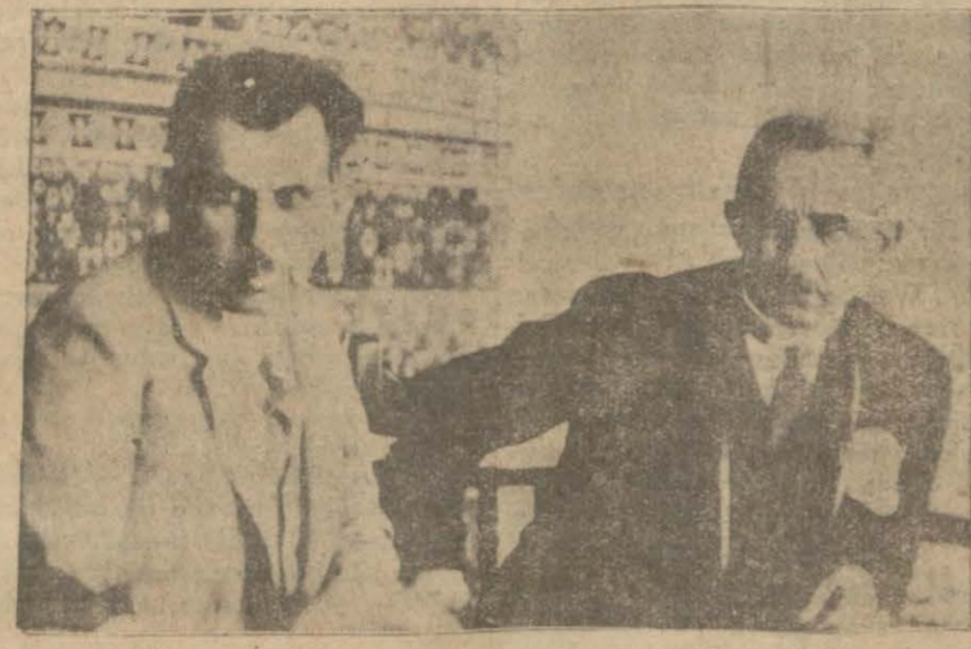
Başvekil İsmet Paşanın B. M. Meclisi Reisi Kâzım Paşa ile birlikte alınmış ve intişar etmemiş bir resmi

Türk-Iran münasebatı ANKARA, 27 (Telefonla) — Bugünkü fırka grubu içtimasında Başvekil İsmet Paşa Türk — İran münasebatı hakkında fırka âzalarını tevdir etmiş ve Hariciye vekilimizin Tahran seyahati, Tahranda müzakere ve intacı mukarrer meseleleri hakkında izahat vermiştir.