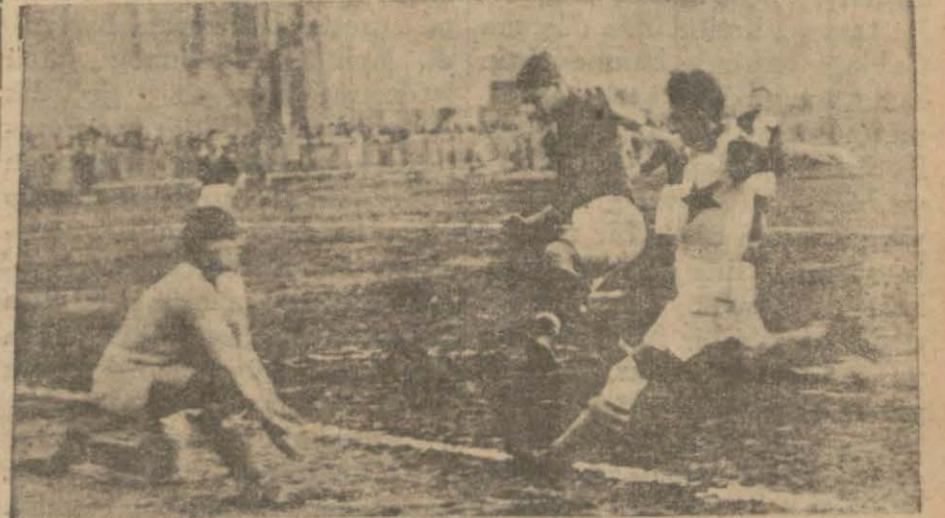
Maçtan heyecanlı bir safha ve bir kurtuluş

ANKARA, 27 (Telefonla) — Yarın Mecliste ihtikârla mücadele lâyihası müzakere edilecektir. Ecebî memleketlerde bulunan memurların ve müstahdemlerin muhassasatlarının tesviye usulü hakkındaki lâyihamın da ikinci müzakeresi yapılmaktadır. Bu münasebetle bu lâyhada ki tesviye usulünün kânunuevvel ayı bidayetinden itibaren tabkına geçilmesi için lâyhaya bir kayıt ilâvesinin teklif edilmesi muhtemeldir.