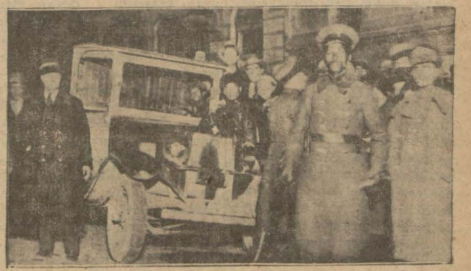
Kaza mahalli ve altı kişinin ağır surette yaralanmasına sebebiyet veren kamyon..