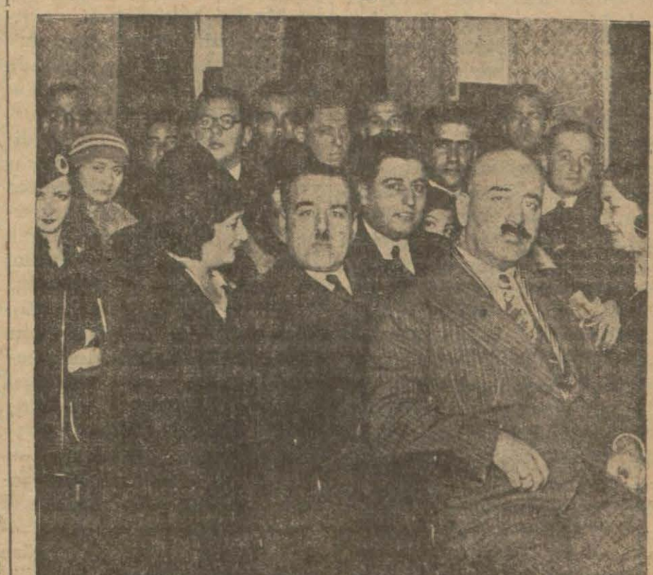
Gaziantepçilerin dünkü içtimalı

Gaziantepçiler dün hazin bir mücadele-nin hatıratını yaşadılar ve 11,000 şehidin kahramanlığını tebci ettiler