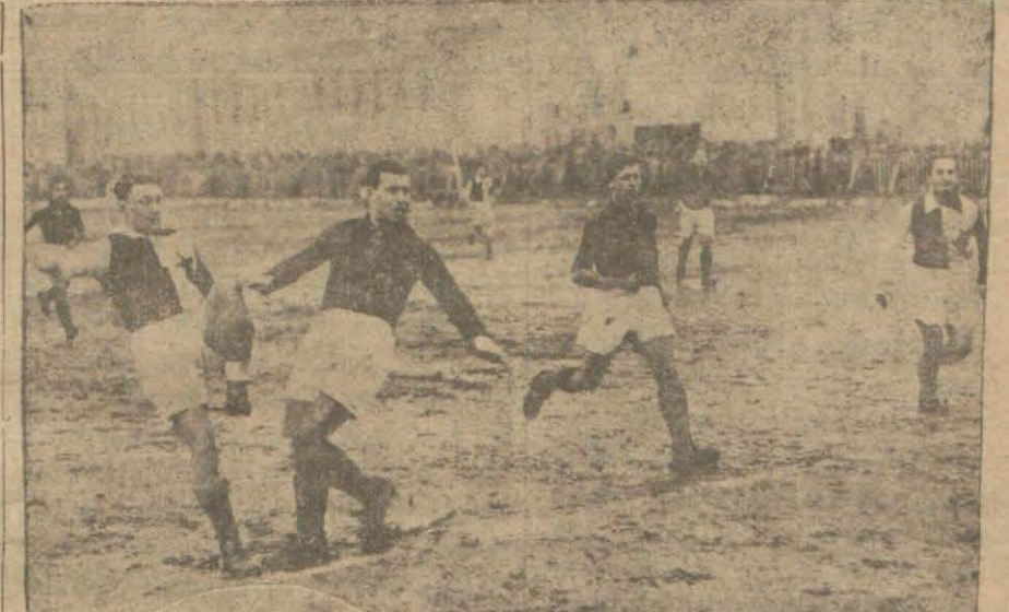
Golle neticelenen bir akın da Slavyalılar

Fakat sahanın çamuru tahammül edilecek gibi değil oyuncuların ayak kapları aşık kemiklerine kadar çamura gömülüyor. Koşmanın, şut çekmenin değil yürümenin imkânı yoktur. (Devamı 5 inci sahifede)