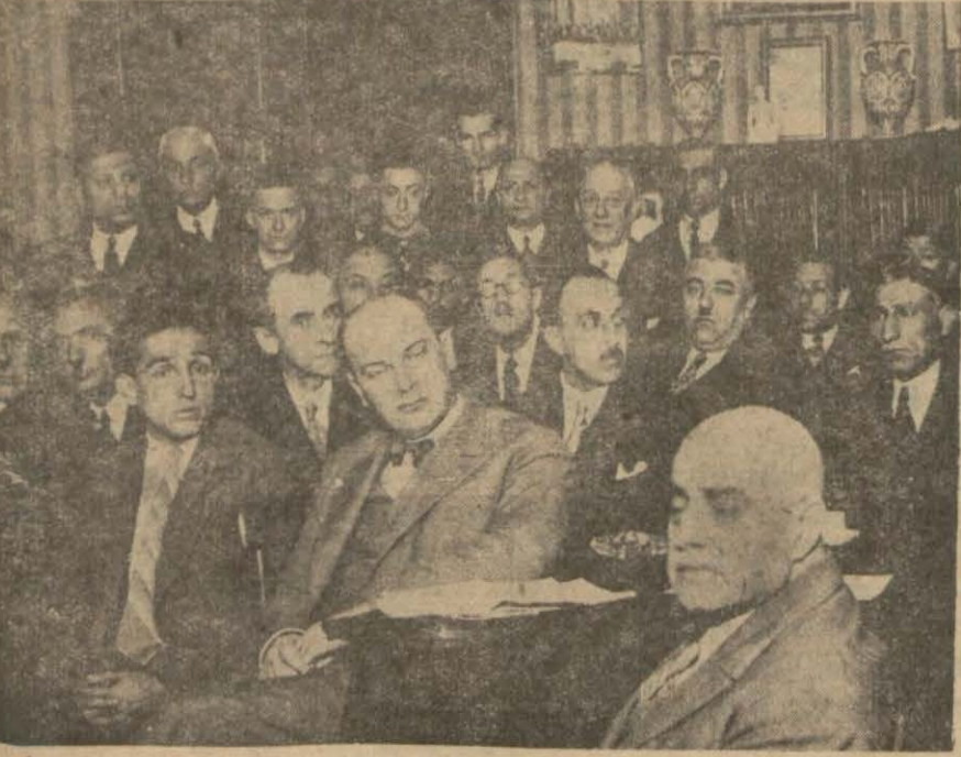
Sanayi birliğinde dün içtima

İçtima münakaşalı oldu. Sanayi birliği kâtibi umumîsi Ankaraya gidecek