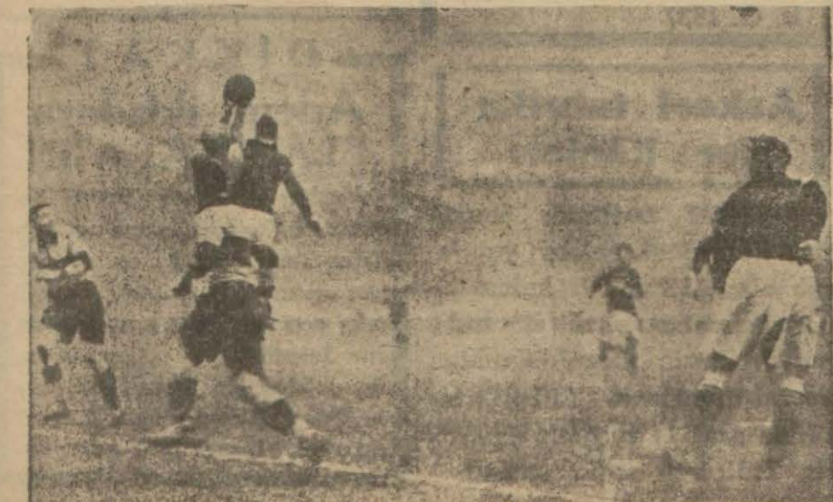
Berlin - Paris maçında çok nazik bir vaziyet