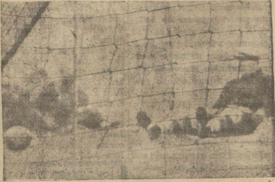
Meşhur Zamora İngilizlerden böyle de gol yemiş...

Almanlar genç oyuncularla takviye edilmiş olan Fransız takımı karşısında harap oldular