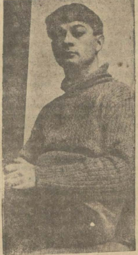
1912 — Kisling

Kisling'i tanıyınız. Kisling'i herkes tanıır. Parise gitmişseniz bir akşam Coupole barında onu size göstermişlerdir. Köşede oturan odur. Harbi unumiden evvel Gottlieb ile düello eden, evvelce haftada