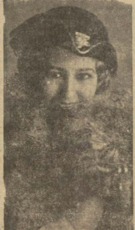
Mm Elvira de Hidalgo

ye etmiştir. On beş seneden beri dünyanın bütün büyük tiyatrolarında ve konser salonlarında temsiller vermiş olan Ma-