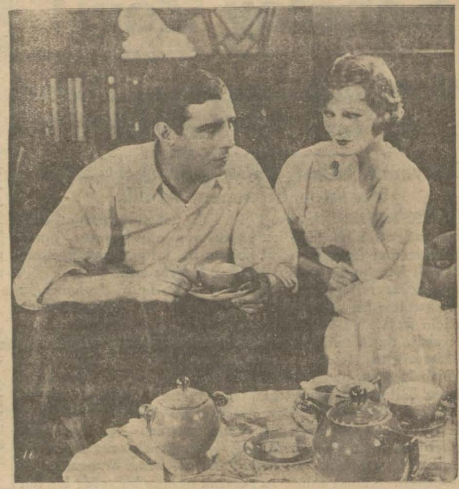
"Gel boşanalım" filminde Henry Garat ve Alice Cocea

Piyesi tamamen ezber bilen Nituş, yeis içinde bulunan direktörün vaziyeti karşısında yakıkkı mülazimin ısrarlarına dayanama yarak bu artistin yerine oynamaya razı olur. Gençliğini tevci eden safiyet ve letafeti, mahcubiyetine rağmen, ona büyük bir muvaffakiyet kazandırır. Perde delicesine alkışlayan ehali önünde iner, fakat ikinci perdenin bidayetine mevkiide bulunan zavallı organuncu sahnenin önünde binbaşım dikildiğini görür. Binbaşı her şeyi unutarak tiyatroya içinde onu takibe başlar, ve Nituşu da kurtarmak isteyen Selemen onu kendisiyle birlikte tiyatroya kapısına doğru sürükler. Sokağa atıldıkları sırada bir devriye tarafından tekyif edilirler ve Dragon karar gâhna götürülürler. Nituş orada tiyatroya bulunan muhafız zabitan tarafından tanılır, ve Selemenle beraber zaferini tes'it için şampanyaya içmeğe davet olunur. Hafifçe sarhoş olan iki dost şataret içindedirler. Nituş masanın üzerine çıkarak