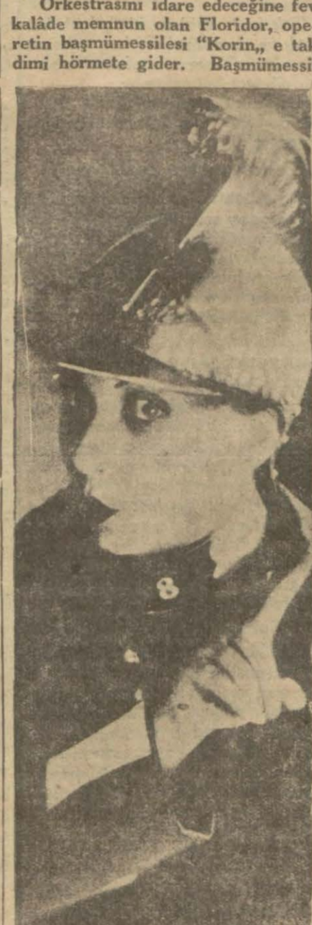
"Mam'zel Nituş" filminden bir sahne

Orkestrasını idare edeceğine fev kalâde memnun olan Floridor, operetin başmümessilesi "Korin", e tak dimi hürmete gider. Başmümessil