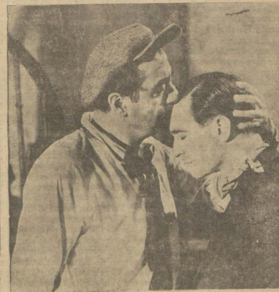
"Marius" filminden bir sahne