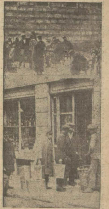
Gerek kahve ve gerek benzin fiatlarının tereffüünde büyük müesseseler ve kumpanyaların rolleri görülmektedir. Küçük esnafın ihtikâr yapmasına meydan verilmemek için meşgul olunurken başlarında beynelmül kumpanyalar bulunan müesseselerin bu tarzı hareketi şayanı hayrettir.

Benzin fiatlarında da son günlerde tereffü görülmektedir. Halbuki buna hiç bir sebep yoktur.