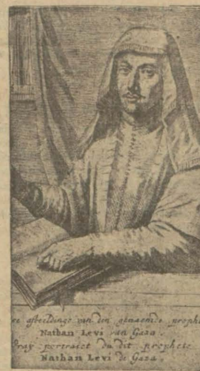
Sabatay Zevi macerasında büyük bir rolü olan NATHAN GHAZATI

ANKARA, 15 (Telefon) — Kızamık hastalığı münasebeti ile hükümet merkezinde ana ve ilk mektepler on beş gün müddetle tatil olunmuştur.