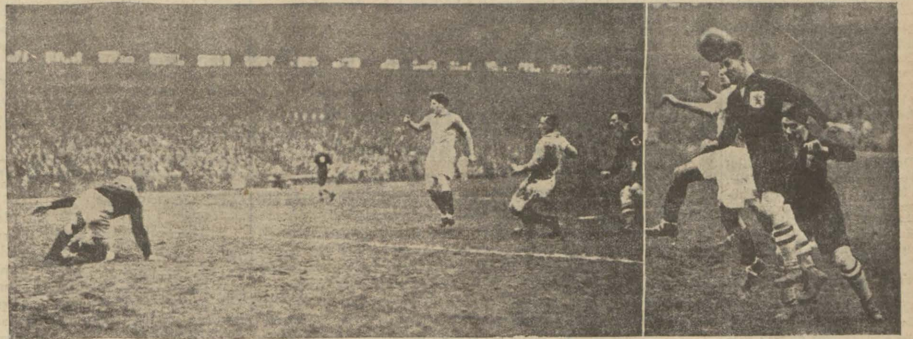
Solda Fransızların Hollandalılardan 19 uncu dakikada yediği gol.Sağda:

Haftanın en mühim ve heyecanlı maçlarından biri de pazar günü Colombes stadında Fransa Milli takımı ile Hollanda Milli takımı arasında yapıldı. Bu mühim maç seyretmek için gelen 20 — 25 bin kişi Colombes stadına toplandı.