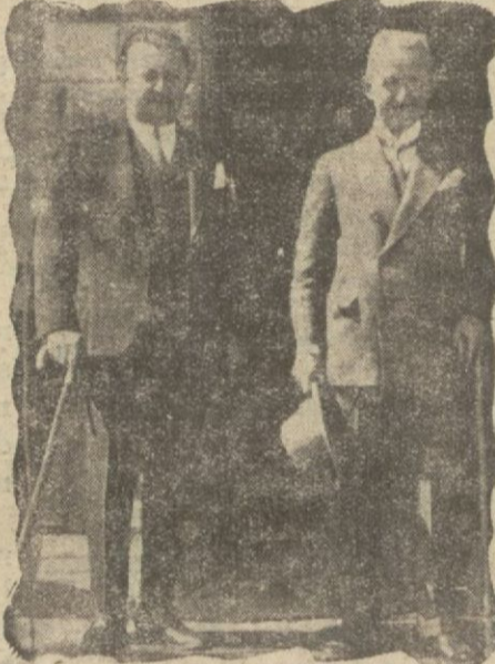
Başvekil İsmet Paşa ve Dahiliye Vekili Şükrü Kaya B. bir arada

Heyeti Vekile içtimaı saat yirmi buçuk kadar devam etti. İçtimadan sonra İktisat vekili Mustafa Şeref Beyle görüştim. Bana yeni kararname ve üç aylık kontenjan listesi hakkında âtedeki malûmatı verdi.