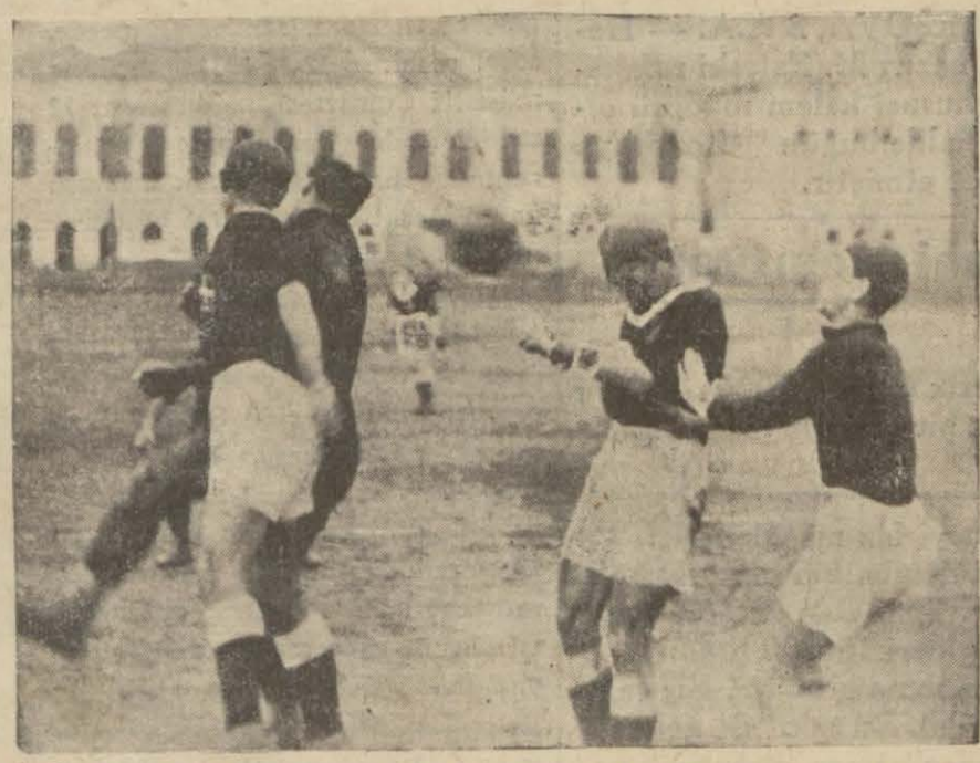
Ölîmpiyat spor mecmuası Pazar İki isimle bir turnuva tertip etti. İlk maç Pera kulübü ve İtalyanlar arasında yapıldı. Resmimiz bu maçtan bir an gösteriyor.