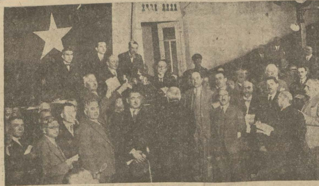
Dünkü intihaptan iki intiba: Solda ilk rey atılırken, sağda reylerini verenler konferans salonunu terkederken.

Türk - Arap münasebetlerini de derinden derine tah- lil eden bu güzel eseri 4 üncü sahifemizde bugünden itibaren takip ediniz.