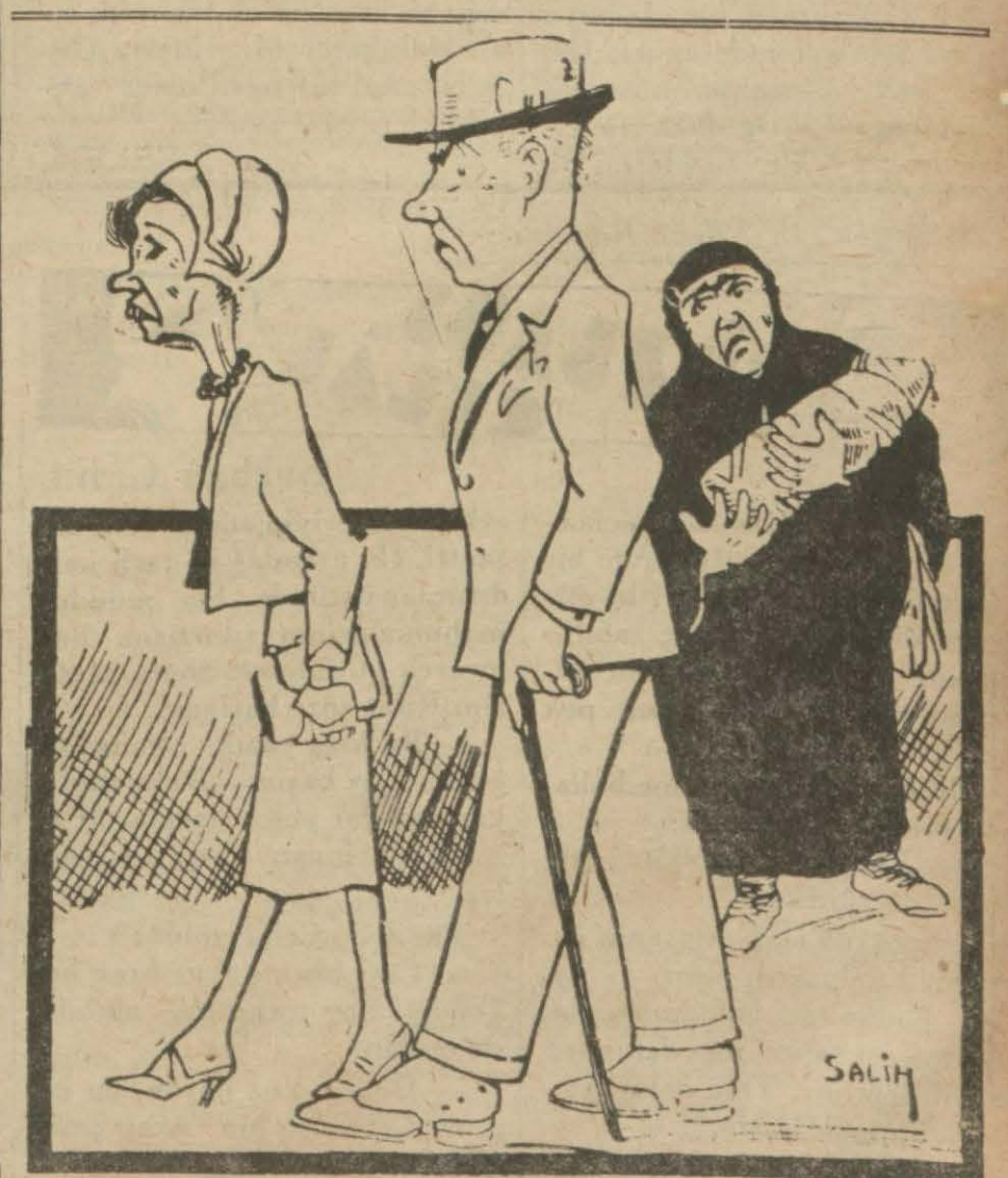
— Allah sevgili gazel hanımcağından ayt. mast. beğim.. Bir sadaka ver!

Izmirde nakledilen kadastro baş fen memurlarına kadastro mektebi muallimlerinden Necmettin Bey ve tapu baş fen memurlarına da Nirengi ve Polinyon şefi Hüseyin Avni Bey tayin edilmişlerdir.