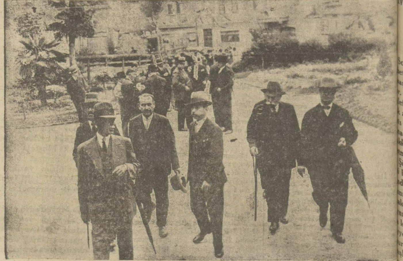
Dünkü mebus intihabında mütehibi saniler rey vermeğe giderken