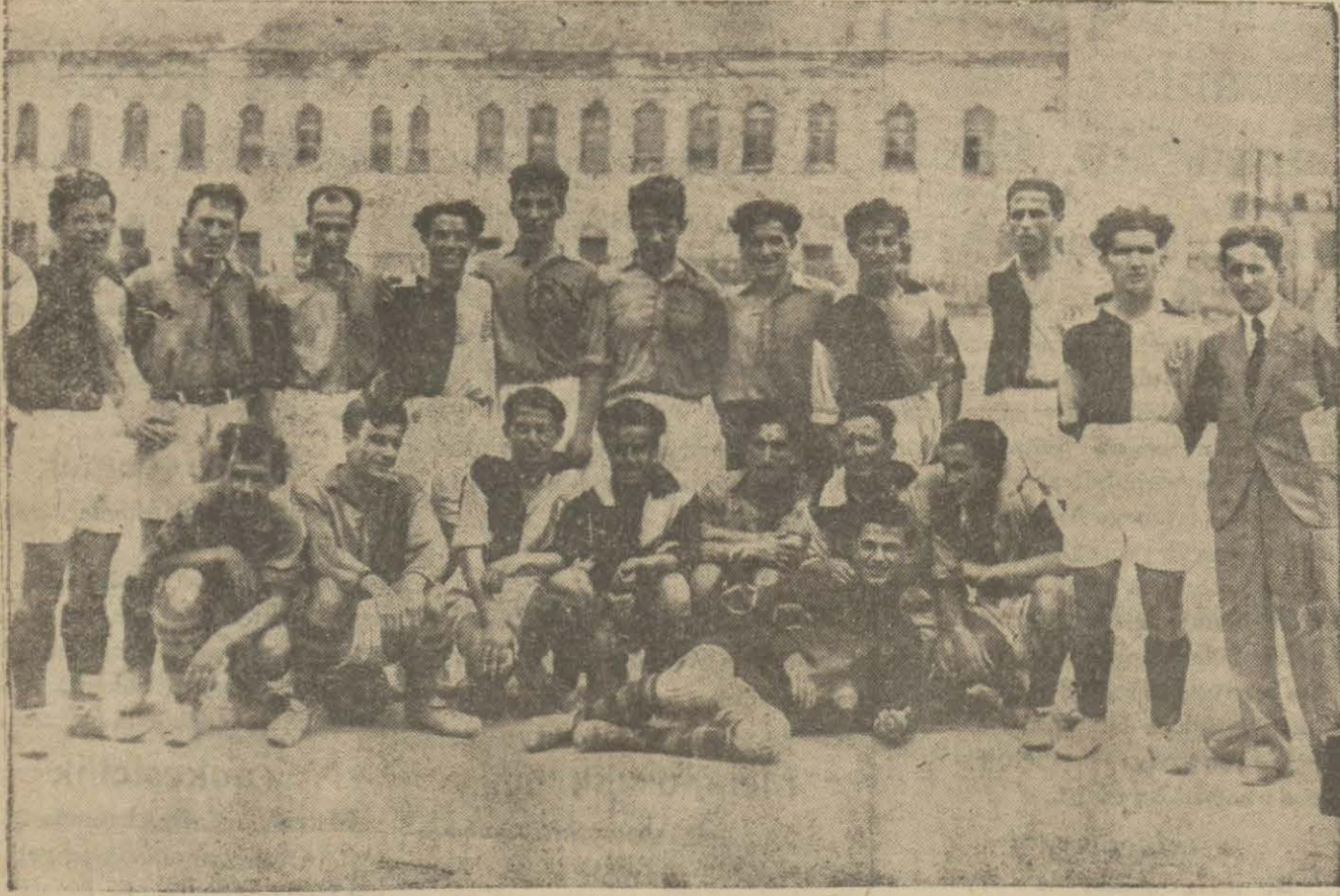
Dünkü lik maçlarından evvel İstanbulspor ve Galatasaray takımları