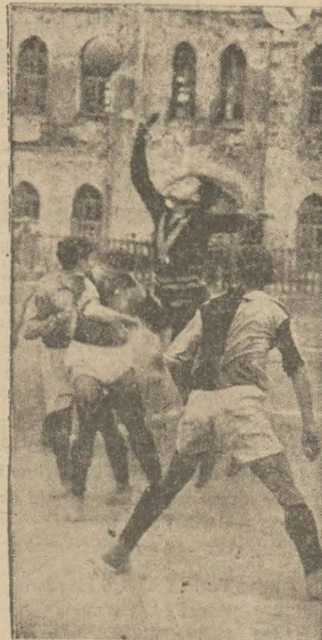
İstanbulspor kalecisinin bir kurtarışı