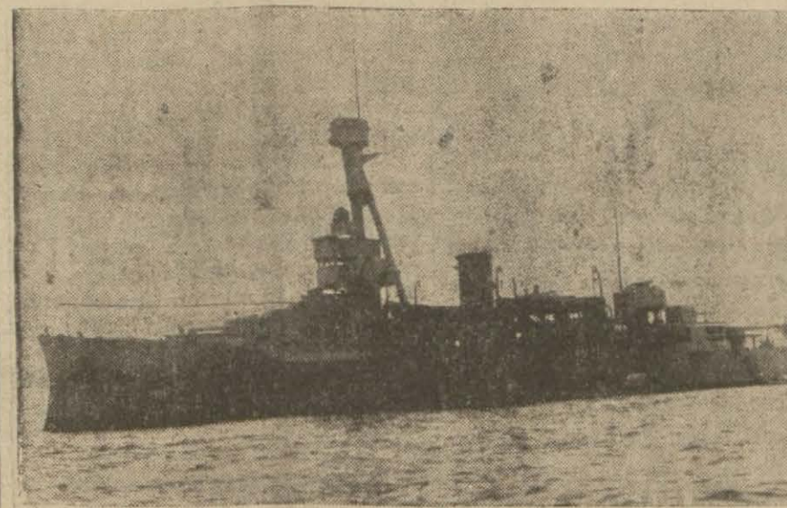
Dün limanımıza gelen Danimarka bandıralı "Vieles,, Zuel,, kruvazörü

Süvarisi bugün Valiyi ve Kolordu kumandanını ziyaret edecek