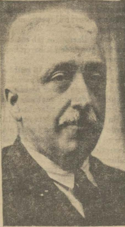
Meb'us intihap edilen muvakkat hükümet reisi ALCALA ZAMORA

MADRIT, 28 A. A. — İntihabat esnasında şimdiye kadar ehemmiyetli hiçbir hâdisse olmamıştır. Tağrada yaptığı bir devir seyahatinden avdet eden M. Lerroux Madritte ortaya çıkan fesat tertibatı sayıların dan Badajoz valisi vasıtasile haberdar edildiğini söylemiştir.