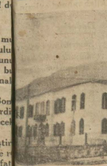
Manisada Orta mektep

Vilâyet dahilinde zirai kredi kooperatifleri tesisine devam olunmaktadır. Çoban İsa ve Sarıhanlı köylerinde ve nefsi Manisa vâdisinde kooperatifler tesis edilmiştir. Mermere, Bakır ve Karaoğlanlı kooperatiflerinin de merasimi kanuniyesi ikmal edilerek tasdik gönderilmiştir.