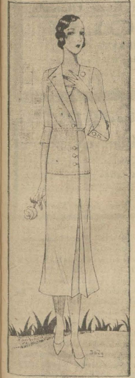
Sade bir kır kıyafeti