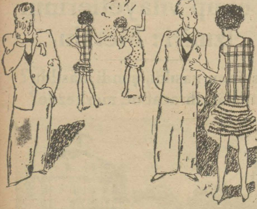
Pazartesi — Doğrusu bu kızıa evlenilmez, Ne ettin de 500 liralık nişan yüzüğü verdin.

Müterakim vergileri ile belediye resinleri vakif icaresi müştieriye aittir. Hakları Tapu sicillerinde sabit olmayan potekli alacaklılar ile diğer alacaklıların ve irtifak hakkı sahiplerinin bu hakları ve hususile faiz ve masarife dair olan iddialarının ilân tarihinden itibaren yirmi gün içinde evrakı müspiteler ile bildirmeleri lâzımdır. Aksi halde hakları tapu sicillerinde sabit olmayanlar satış belidinin paylaşılmadan hariç kalırlar. Alacaklıların yeni icra ve iflâs kanununun 119uncu maddesi hükümlerine ve tevfihi hareket etmeleri ve daha fazla malumât isteyenlerin 930/415 dosya numarolu memoriyemize müraacaatları ilan olunur.