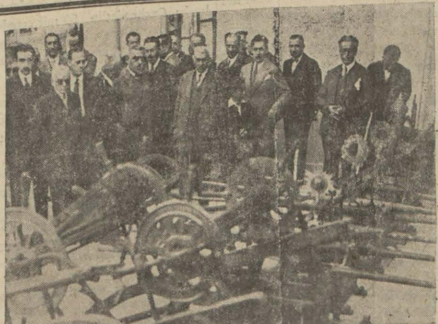
Dün Fatih'te İtfaiye müzesinin küşat resmi icra edildi ve bu münasebetle itfaiyemizin faaliyetine işaret eden plakalar yapıldı. Resmimiz müze gezilirken alınmıştır.

şlandı. Gece halkın istirahatini selb eden bu hal bilhassa İstanbul uzak semtlerinde oturanları merakveendişeye düşürmüş gazetemize muhtelif yerlerden telefon edilmiştir. Aya silâh at-