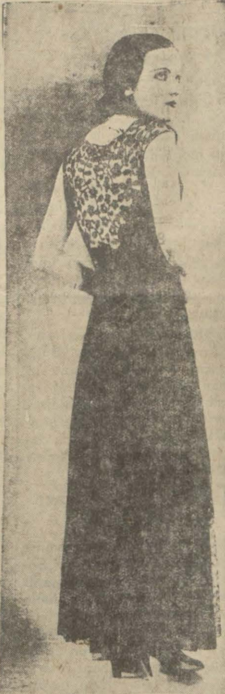
Krep korjet ve siyah dantelâdan akşam tuvaleti. Jüp geniştir ve bir dantelâ bandı ile tezyin edilmiştir.

Tam mevsimindeyiz, hem bu şekersiz reçele çocuklar bayılır. Ayrıca şeker masrafına da lüzum yoktur. Gayet olmuş üzümlerden intihap edersiniz ve bu üzümle ezerek suyunu çıkarırsınız. Bu suyu ateşe koyarsınız ve yarı yarıya gelecek surette kaynatırsınız. Bundan sonra içine küçük küçük doğramak suretiler armut, havuç ve kavun atarsınız. Ayrıca bir kilo başına ince dilimler halinde bir limon ilâve edersiniz. Tekrar üçte biri kalacak surette kaynatmağa devam edersiniz. Bu reçel üzüm ne kadar olgun olursa, o kadar tatlı olur.