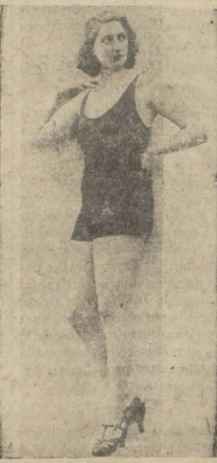
Belçikada 1932 güzelinin intihap edildiğini yazmıştık. Vilâyetler...