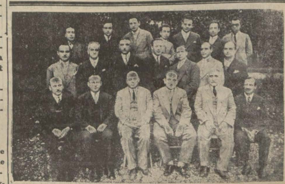
Hayriye Lisesi heyeti talimiyesi

Etibba muhadenet cemiyetinin dünkü içtimar İctimada intihap müddeti biten eski Türk Ocağı binasında fevkalâde bir içtima akdetmiştir. Lütfen shifeyi çiriniz