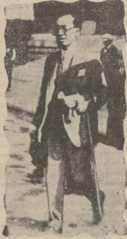
Hariciye Vekili Tevfik Rüştü B. maruzatta bulunum. Ankarada Başvekil Paşa Hz. ne de arzı malû (Devamı 5 inci sahifede)

— Cenevre seyahatinin neticeleri hakkında Reiscümhur Hz. ne