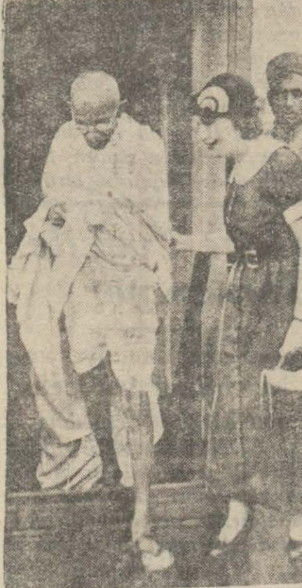
Gandhi'nin Avrupada alınmış bir resmi

LONDRA 15 (A.A.) — Yuvarlak Masa konferansı dün açılmıştır. Gandhi içtimada hazır bulunmuştur. Ancak partizesi günleri söz söylemek âdeti olmadığından müzakereye katılmamıştır.