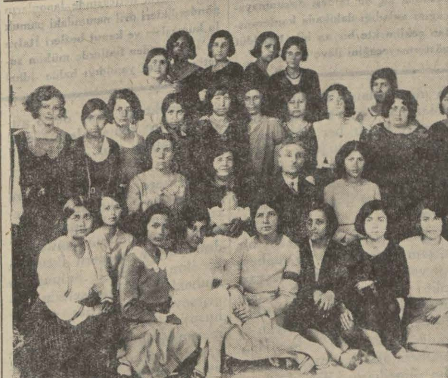
Çemberlitaş biçki, dikiş, nakış mektebi muvaffakiyetli bir sergi yaptı. Resmimiz mektebin son sınıf talebelerini gösteriyor. Yazısı maarif haberleri sütunumuzdadır.

Diğer taraftan tahkikatımız (Devamı 5 inci sahifede)