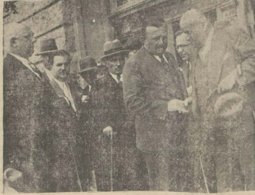
Şükrü Kaya Beyi istikbal

Şükrü Kaya Bey dün Ankaradan geldi, Vekâlette ve valiler arasında bazı tebeddüller oldu..