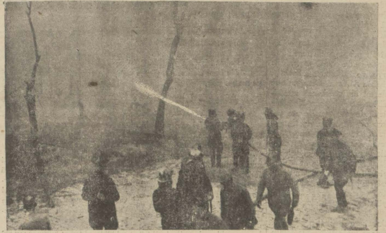
İtfaiye cansiparane bir gayretle denizden getirdiği su ile yangını söndürmeye çalışıyor

Fransa sefiri burada bulunmadığından refikası madam de Beaumarchais, hava işleri nazırı M. Balbo, birçok tayyare zabıtları ve birçok şahsiyetler kendilerini istikbal etmişlerdir.