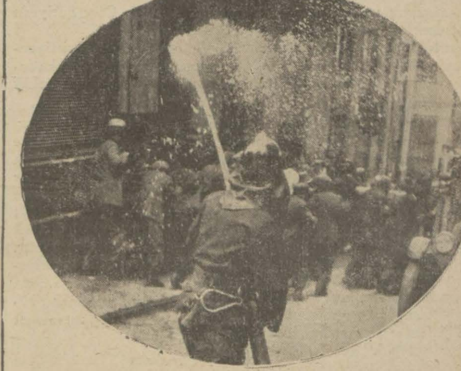
İtfaiye sokakları işgal ve gelüp geçmeyi men eden kalabalığı dağıtıyor