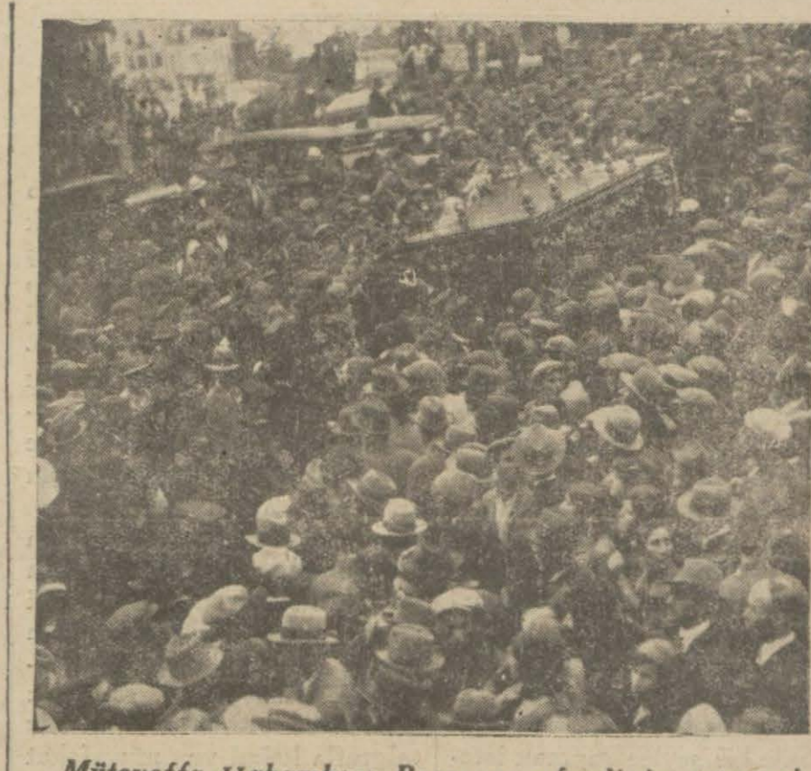
Müteveffa Hahambaşı Becerano efendinin cenazesi mezaristana naklediliyor

ANKARA, 4 — Son tasarruf dolayısıyla memuriyetlerinden çıkarılan bir çok memurlar buraya gelmişlerdir. Bu zevat kendilerini yeni bir iş bulmak için sağa sola baş vurmaktadırlar.