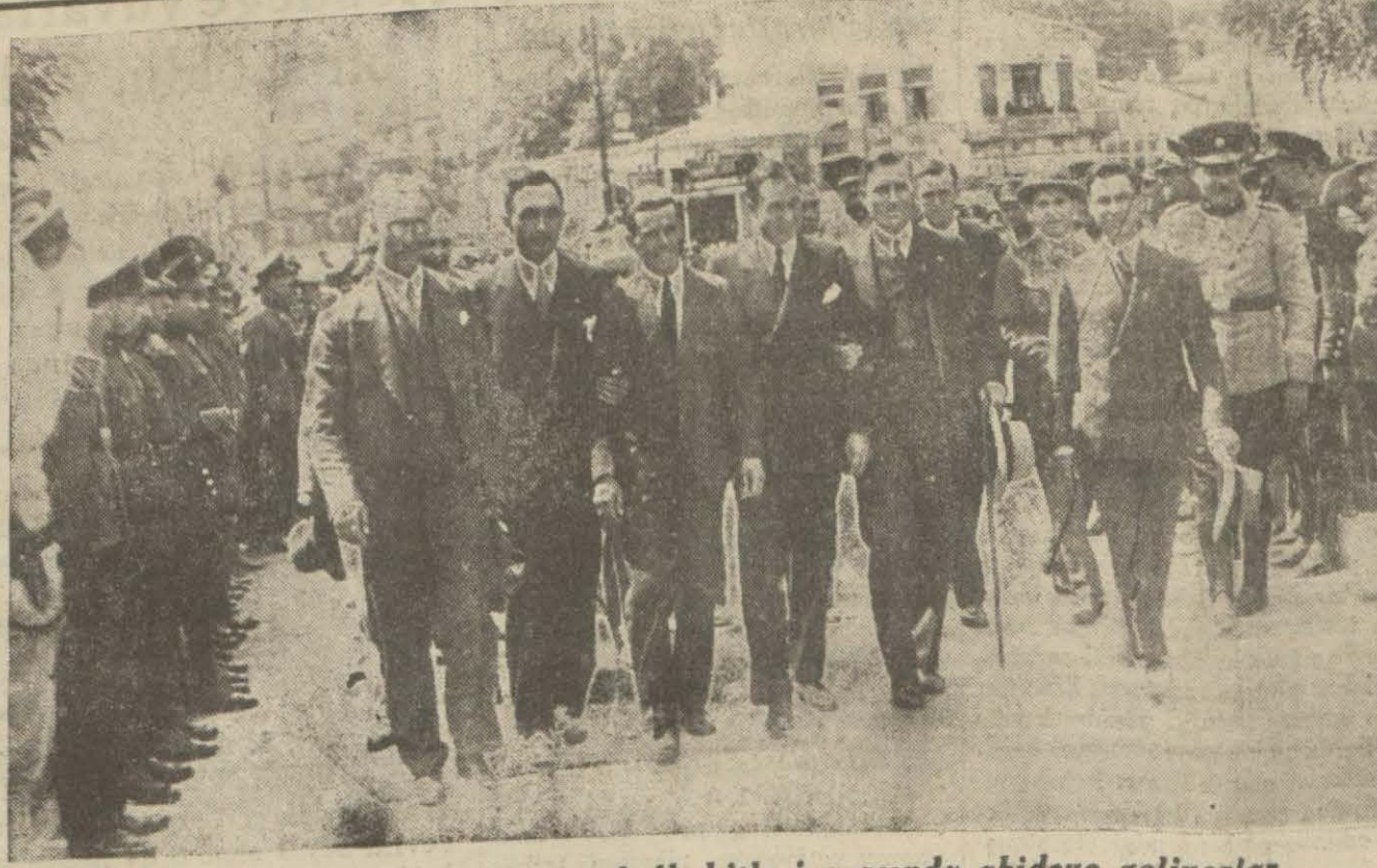
Hava kahramanları kesif bir halk kitlesi arasında abideye geliyorlar