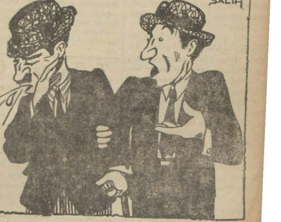
— Aman birader ne yapıyorsun, tükürdüğünü görür lense Belediyeciler şimdi ceza atırlar! — Görseelerde ne çıkar; Belediye bu varidat membanı unuttu gitti, hem şimdi başka işlerle meşgul!