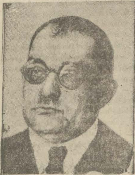
Istanbul heyetine riyaset edecek olan Sadettin Ferit Bey

Türk tarihinin en şerefli günlerinin devrini idrak etmekte olduğumuz bu anlarda, bir an bundan 9 sene evvelle ibretle bakmak, İstanbul heyetinin bir kâbe gibi tavaf edeceğimiz mezarı ziyaret eden büyük Şehidin sonsuz büyüklüğü hakkında bizi bir daha düşündürür. O zamanlar İstanbul işgal altındaki elim manzarasını şöyle göz önüne getirenler, halâs ve hürriyetin neşesi