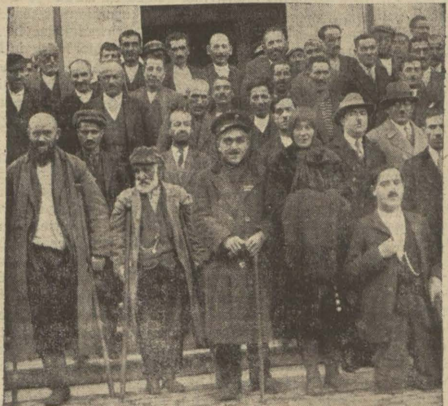
Dünkü kongreye iştirak eden malûllerden bir grup

Hararetili bir müzakereden sonra eski heyeti idare ipka edildi