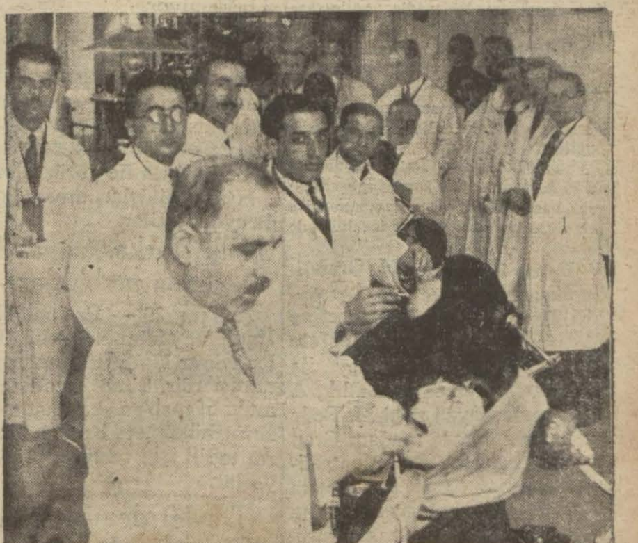
Dişçi mektebindeki klinikten bir kışe