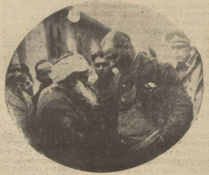
Gazi Hz. uğradıkları yerlerde halkla temas ederek ihtilaçlarını tespit ve tetkik ediyorlar. Yukarıdaki resimlerimiz Büyük Gazisi Turhal ile Amasyada halkın ihtilaçlarını dinlerken gösteriyorlar