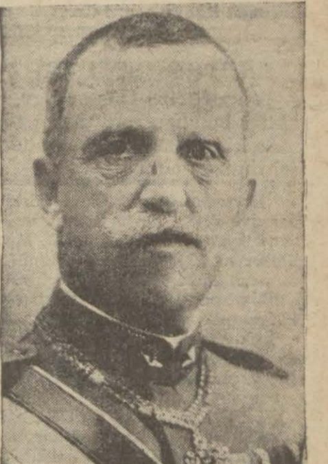
Tevfik Rüştü Beyi kabul eden İtalya Kralı Viktor Emanuel Hz.

"Müktebil itimat ve teşriki mesai arzusuna istinat eden Türkiye — İtalya münasebatı tamamen ve memnuniyet bahş bir şekildedir. İtalya, Gazi'nin şahsında kendisine lâzım olan yeni fikirleri ve kudretli reisini bulan yeni Türkiyenin itilâsını hususî bir âlaka ve muhabbetle takip etmektedir. Tür