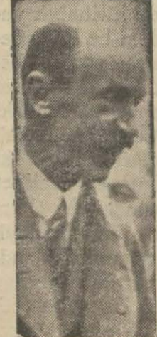
Kornel Bethlen, Macar başvekilidir. (Devamı altıncı sahifede)

BUDAPEŞTE 19 (A.A.) — Pasvekil Kornel Bethlen, meb'uan hariciye emtineninde Türk Macar dostluk münasebatı hakkında pek hararetle sözler söylemiştir. Başvekil, seyahatının siyasi ehemmiyetinden başka iktisadi ehemmiyetini de ihmal etmemek lâzım gelğini beyan etmiştir. Yeniden canlanan