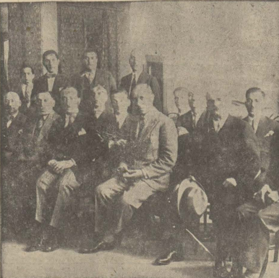
Dün manifaturacılar cemiyeti heyeti idare intihabı yapılmıştır