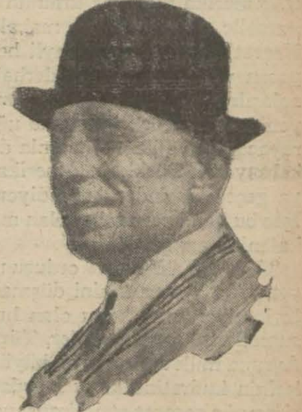
Mehsul terakkiperver fırkanın ihyası teşebbüsünü tekzip eden Refet Paşa

İzmir, 20 — Yeni Asır başmuharriri İsmail Hakkı Beyin Serbes fırka mensuplarından müteşekkil olmak üzere yeni bir fırka açacağı hakkında dün kuvvetli bir rivayet çıktı. İsmail Hakkı Bey ve arkadaşları öğleyin saat 12 de bu mesele etra-