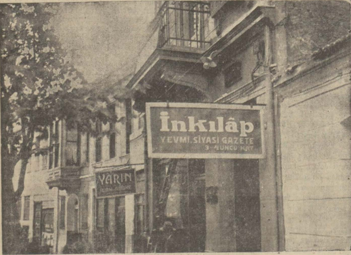
Bir tabanca atılma habîsinein coreyan ettiği mahal. Tabancanın henüz kimin tarafından atıldığı malûm değildir