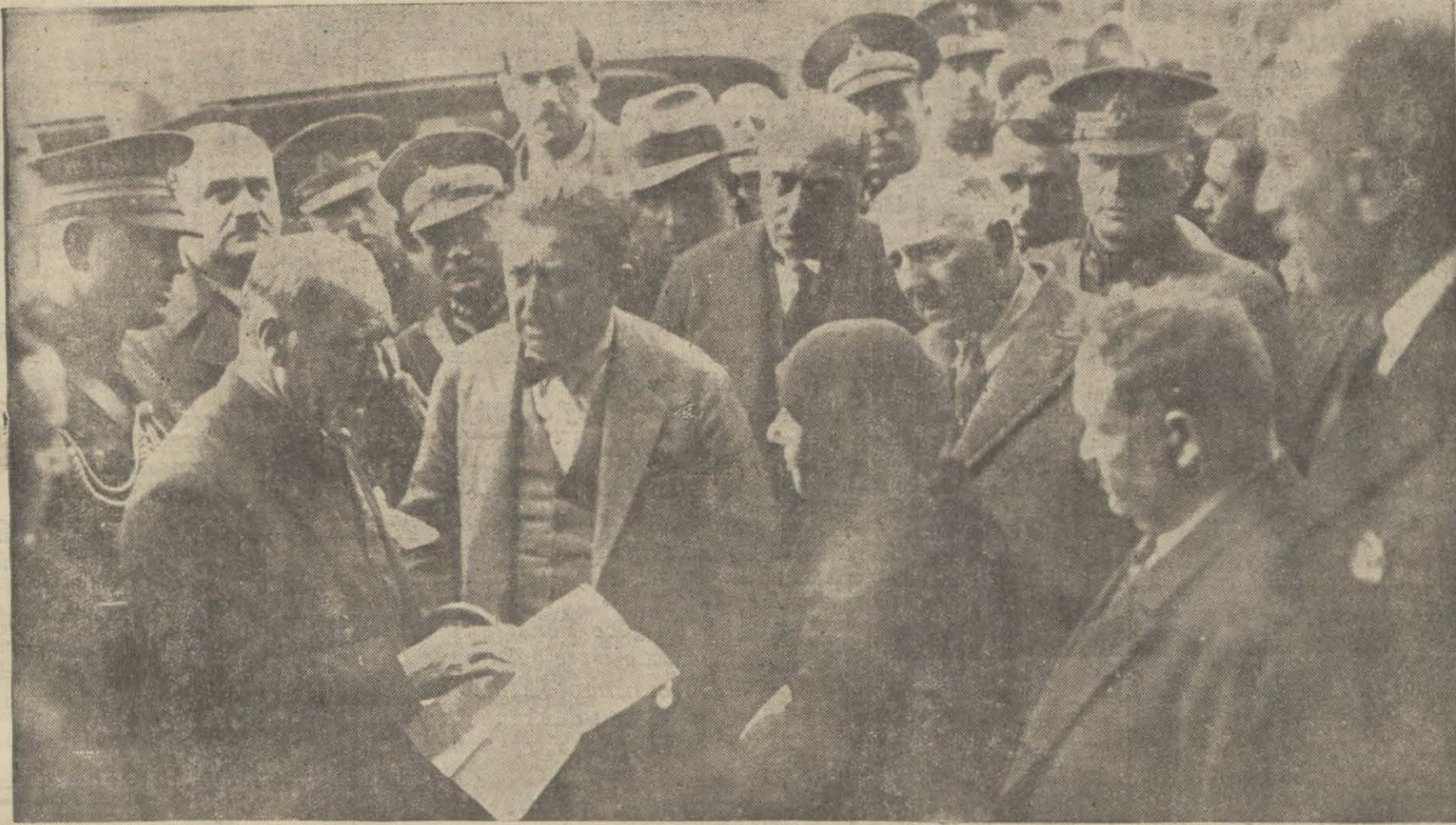
Gazi Hz. Kayseride bir hanım tarafından kendilerine takdim edilen İstidayı kabul buyuruyorlar.