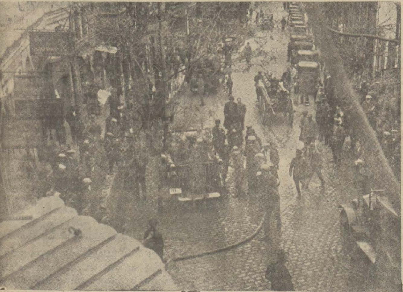
Dün Ankara caddesinde Reşit Paşa hanında bir yangın çıkmıştır. Resmimiz bu yangın başlangıcını göstermektedir