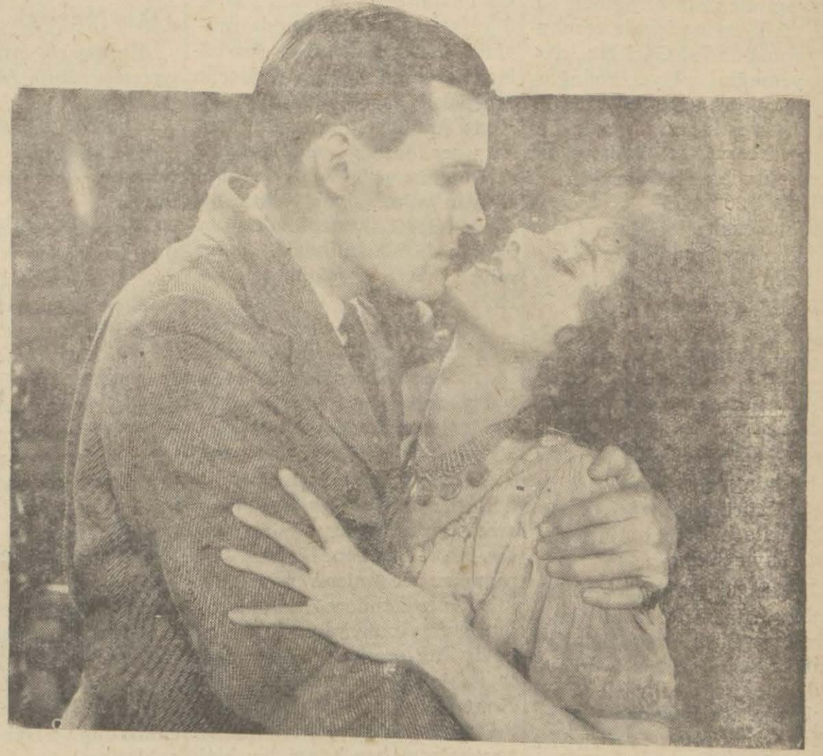
"Sevginin zevki", Majik'te