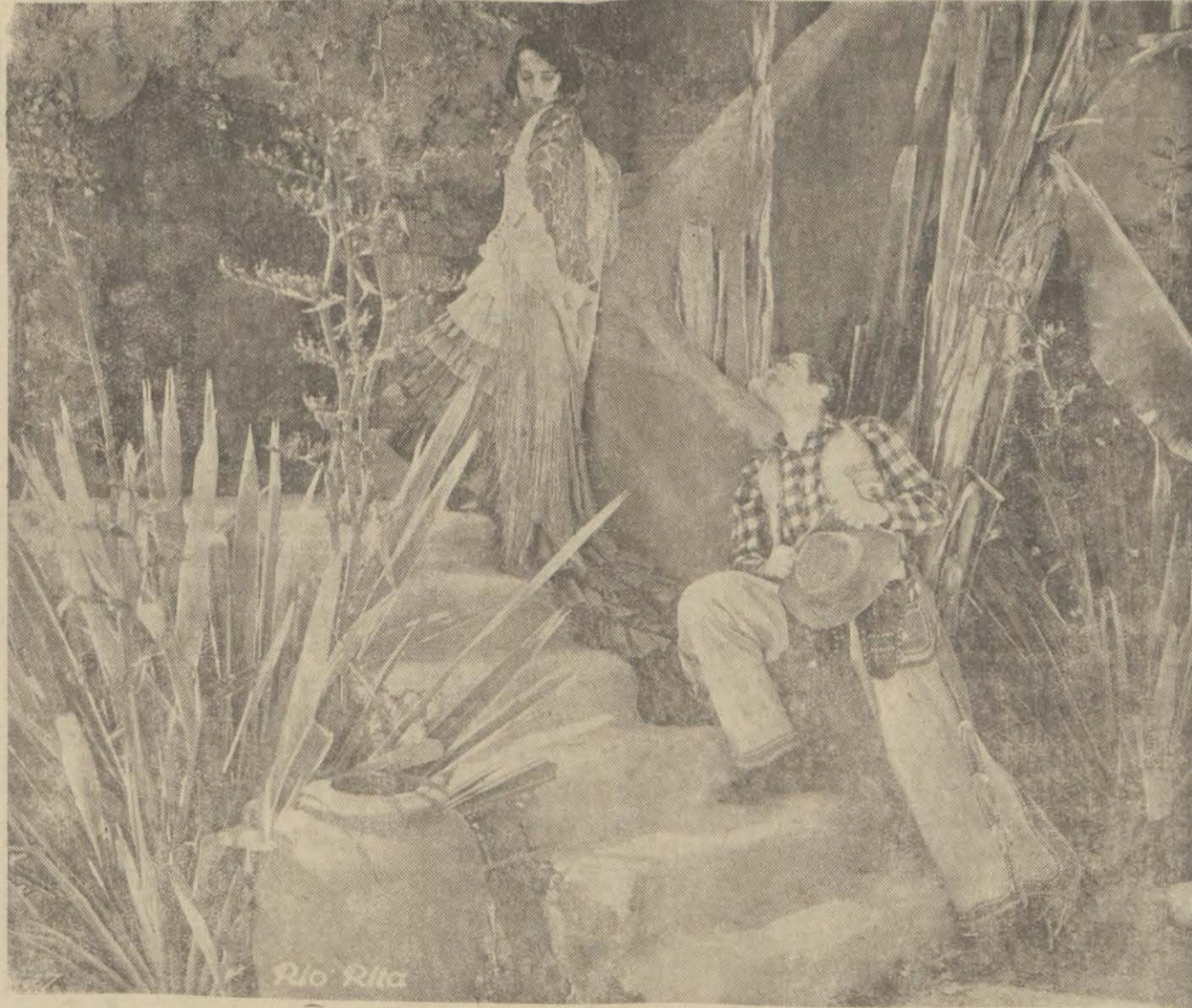
"Rio Rito", Opera'da

Tamamen renkli olan bu film İngilizce sözlü ve şarkılıdır ve (Serseri Kral) ismindeki bir operayı avnen ihtiva etmektedir.