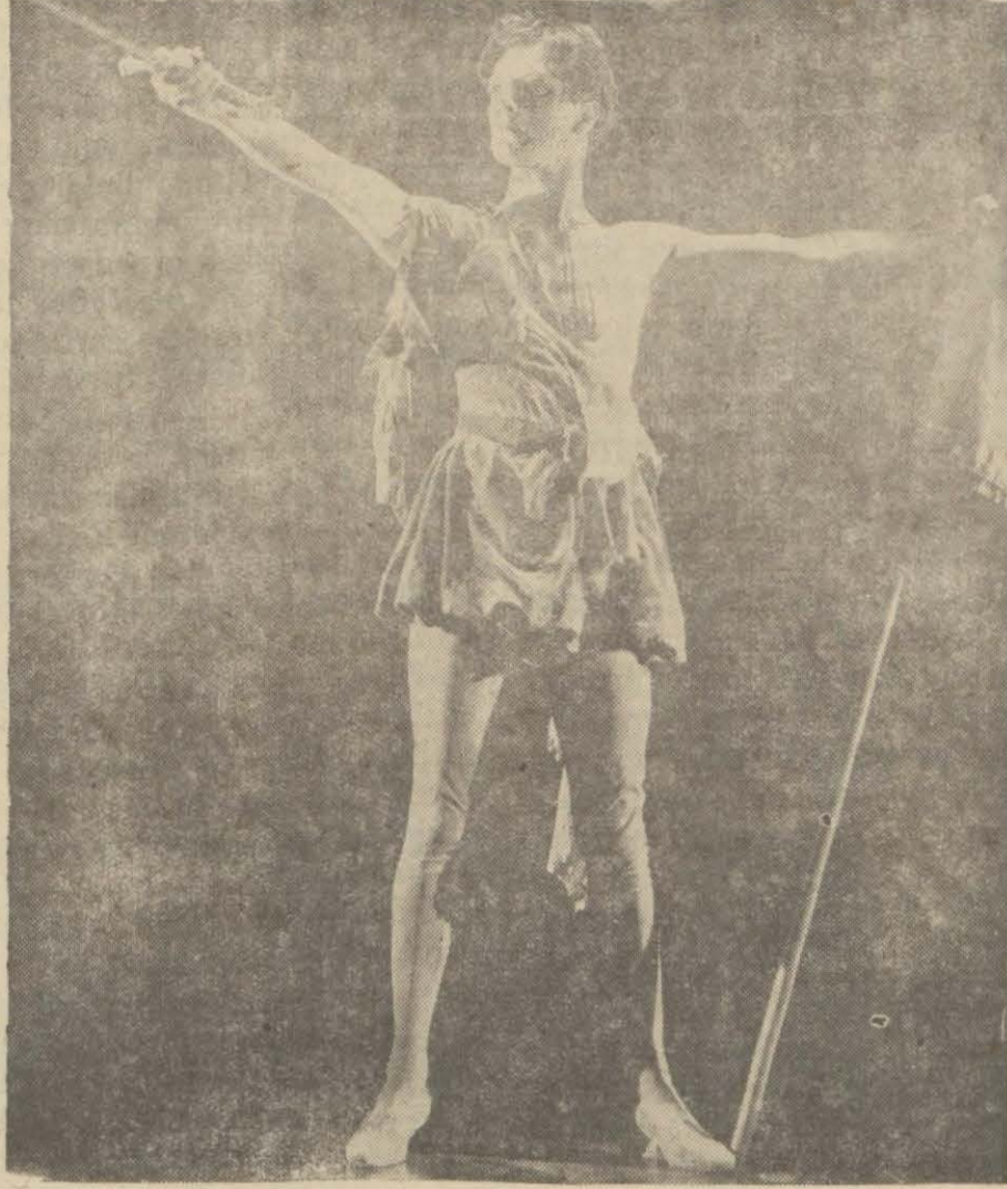
"Serseri Kral", da Denis King