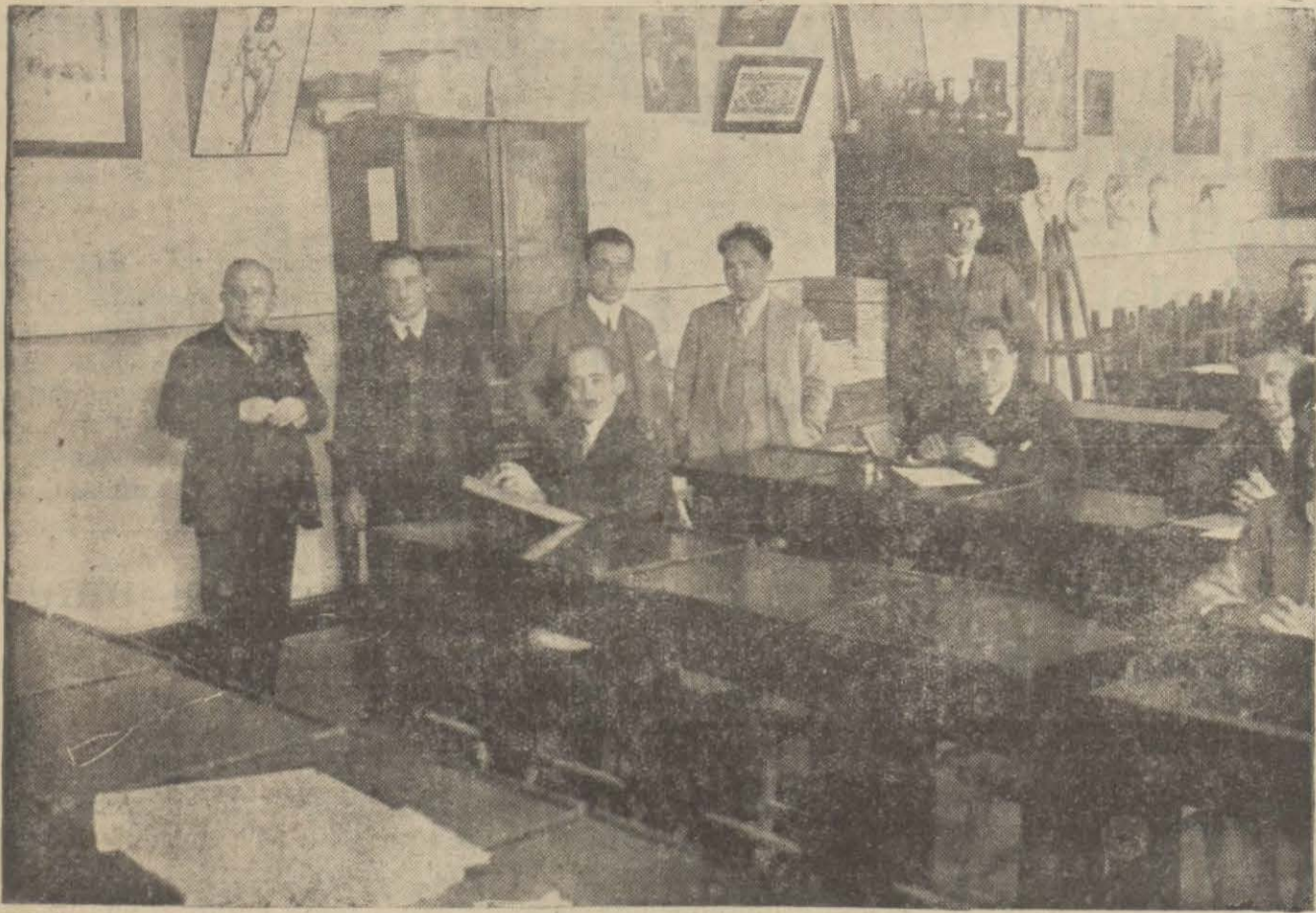
Dün ilk mektep müfettişleri İstanbul Erkek muallim mektebinde imtihan edilmişlerdir