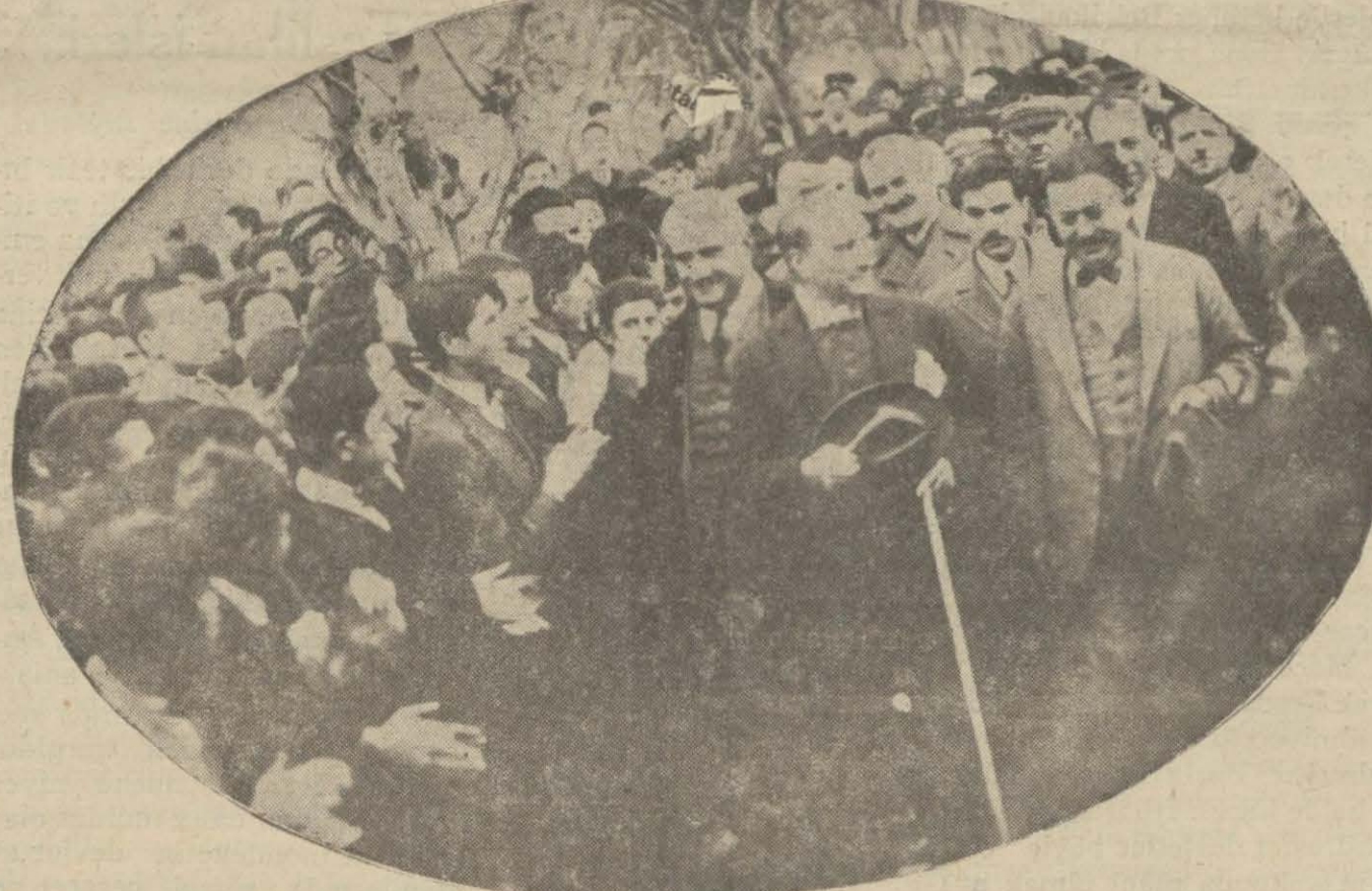
Büyük Reisimiz Türk gençliğinin alkış ve çılgın muhabbetleri arasında..

SIVAS, 20 (Hususî) — Dün geceyi Kayseri ile Sivas arasındaki Gemerek istasyonunda trende geçiren Gazi Hz. bu sabah hareketle öğle yemeğini Yıl dızda yemişler ve saat on dörtte Sivasi teşrif etmişlerdir. Büyük Reis Hükümet erkânile binlerce halk tarafından istikbal edililer ve halkla beraber yeni şosede yürüyüp otomobillerle hükümet, askerî fırka, belediye,