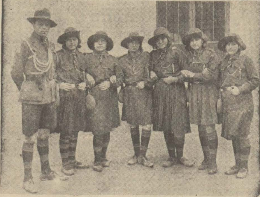
Tekirdağ muhtelif orta mektep Bozkurt Oymağı izcilerinden bir grup