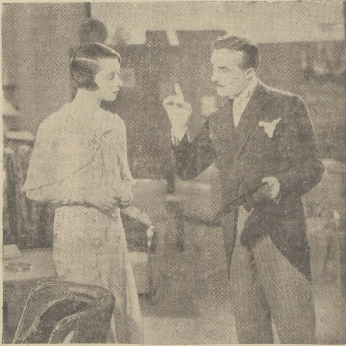
"Sevginin zevki", Melek'te

Bu film Nev-York'un Broadway kısmında iki defa gösteril-