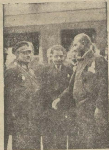
Reisicumhur Hz. Kayseri istasyonunda

SIVAS, 20 (Hususî) — Dün geceyi Kayseri ile Sivas arasındaki Gemerek istasyonunda trende geçiren Gazi Hz. bu sabah hareketle öğle yemeğini Yıl dızda yemişler ve saat on dörtte Sivasi teşrif etmişlerdir. Büyük Reis Hükümet erkânile binlerce halk tarafından istikbal edililer ve halkla beraber yeni şosede yürüyüp otomobillerle hükümet, askerî fırka, belediye,