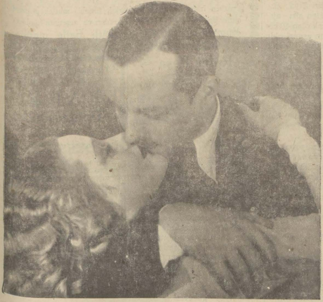
"Aşk çocuğu", Gloria da