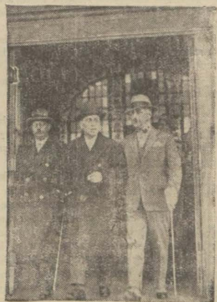
Fethi Bey dün Haydarpaşa İstasyonundan çıkarken

Fethi B. izahat veriyor Fethi Bey arkadaşlarının bir çok suallerine cevaben kendi noktai nazama göre uzun izahat vermiş, fırkasının devamı faaliyetine imkân kalmadığı için infisah vaziyetinin zaruri olduğunu, artık yeni bir fırka teşkil edemeyeceğini söylemiştir.