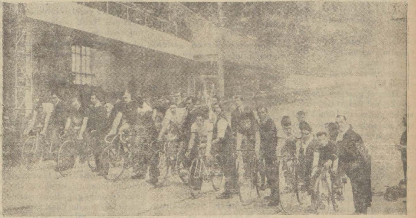
Fransızların kapalı küçük spor mahalli stadyon...

Bundan sonra, vali hey'eti merkeziyenin vilâyet salonunda içtima etmesini teklif etti ve kabul edildikten sonra hey'etlere muvaffakiyet temenni olundu, kongreye nihayet verildi.