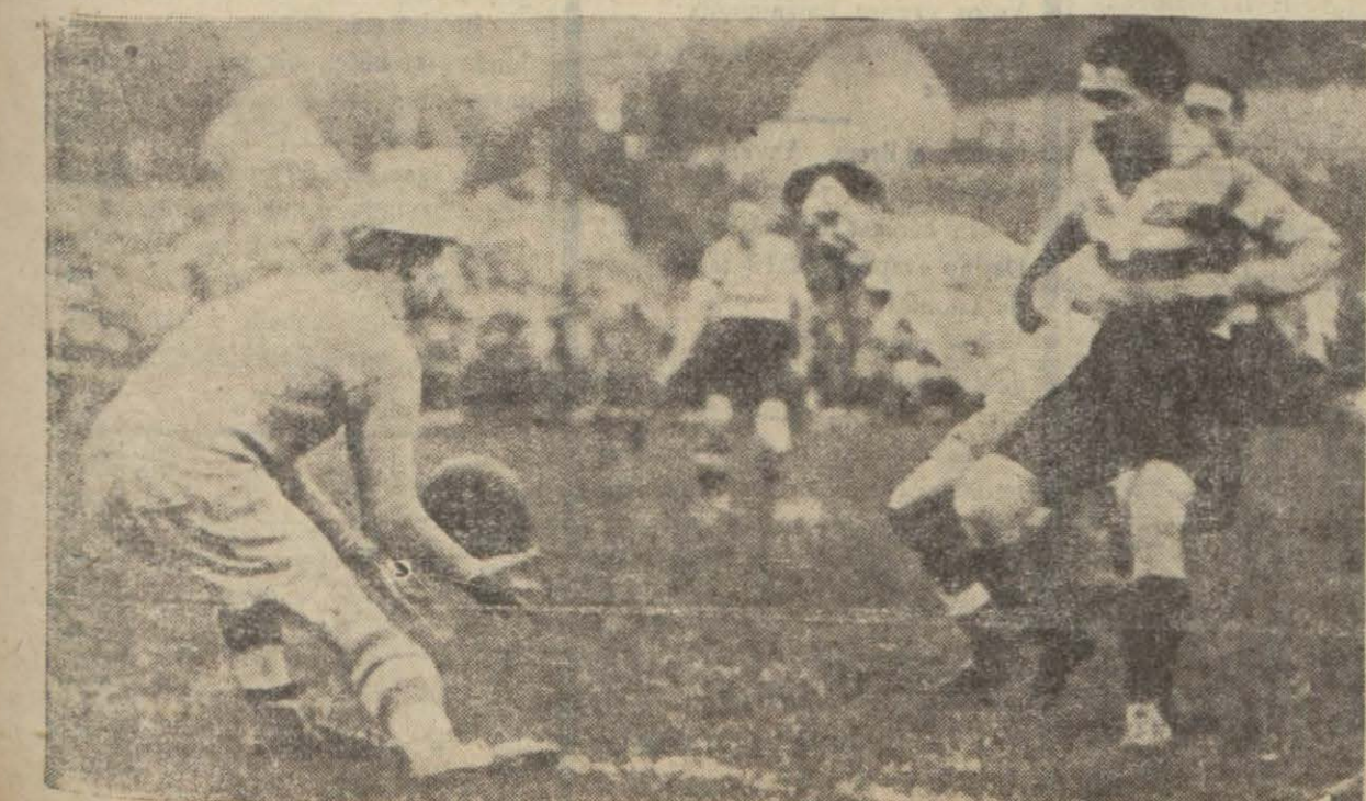
Londra - Paris maçından bir eustantane

Nihayet binlerce kişinin alkışları, candan teşyileri arasında koştu ve o eski hayaller bir hakikat oldu. Ladomeg'i resimde de görüldüğü veçhile hâlâ sahayı, tribünleri terketmeyen binlerce kişi önünde "şeref, koşuşunda görüyoruz. Kendisi bu gün bakım ne düşünüyor: "1500 metre rekorunu aşığı yukarı iki saniye bir farkla kır-dım. Alman şampiyonu D. Peltezerin 3,50 rekoru 3,49 oldu. Rekorum uzun müddet baki ka-