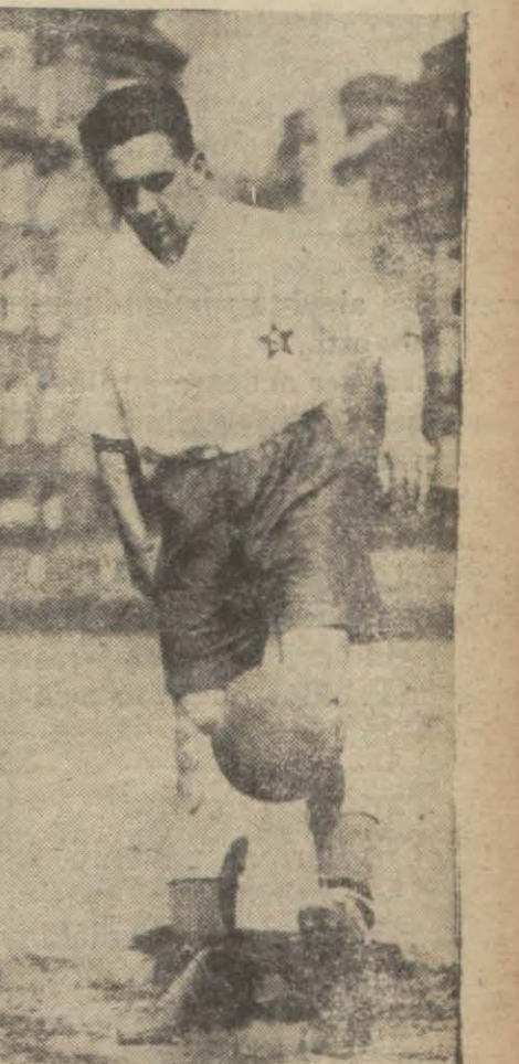
Sparta takımına geçen Belçikalı beynelmîlel oyuncu R. Bren

Dünya eski güleş şampiyonlarından (Shikat)NüYorkta da-