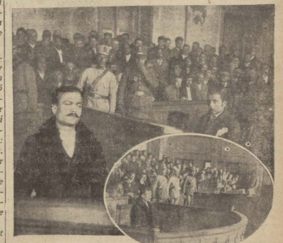
Katil de, maktul de, şahid de hep hapıseano koğuşundan çıkan bir dava

Observer gazetesi, bu yeni vaziyetin ihdasından M. Venizelosla beraber çalışmış olan İsmet Paşaya bir hisse şerefi ve takdir ayırmakta ve An karada imzalanmış itilâfların şark karpide siyasi vaziyetin inkişafı için yeni bir safha vaidettiğini kaydelemektedir.. (Observer) gazetesinin ciddiyet ve ehemmiyeti nazari itibara alınrsa, bu mütaaleti, İngiliz Hariciye nezaretinin vaziyetinin bu tarzda inkişafından dolayı memnuniyetini göstermesi itibarile şayan kayıt ve dikkat telâkki edilmektedir.