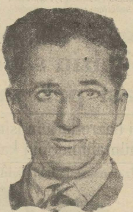
Mahpus İspanyol tayyarecisi Franco

MADRİT, 9 A.A.— Heralt gazetesi G-38 Alman tayyaresinin başteknisyeninin bir mektubunu neşretmektedir. Mumaileyh, Tayyareci Franco'ya hitaben yazmış olduğu bir mektubta Franco'nun tayyareyi muayene edememesine, teknik mütealemmi beyan etmemesine ve bilhassa müstakbel hava mu