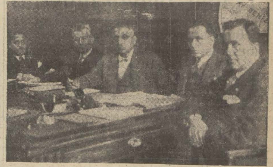
Ticaret Odasının fevkalâde içtimasından bir köşe

79 ncu hafta başlamıştır. Gazetemizde çıkan haberlerden en mühimni seçip cumartesi akşamına kadar müsabaka memurlarına gönderiniz. Neticeler pazar günü neşredilecektir.