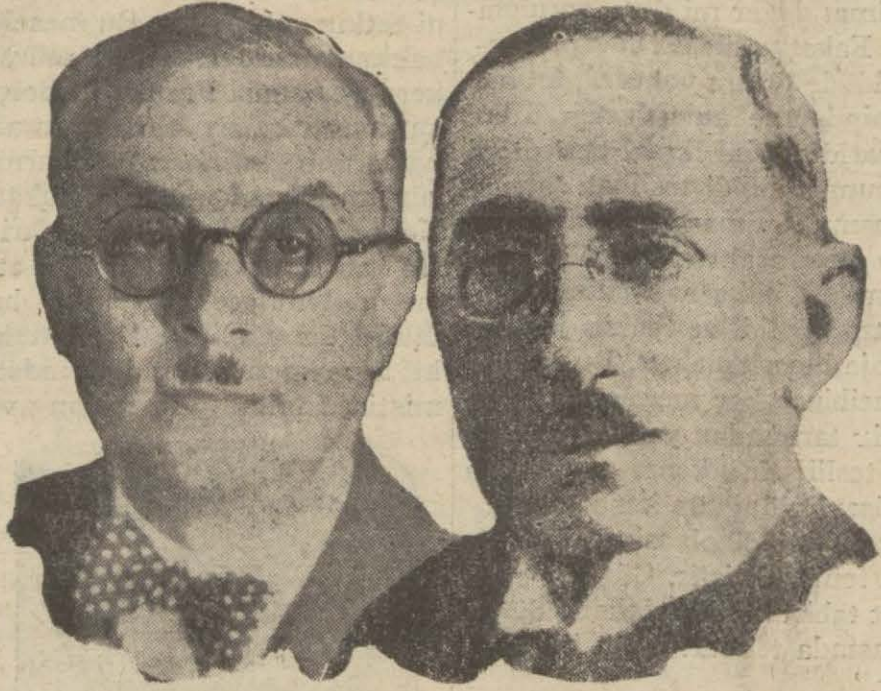
Cemil B. "Tekirdağ,"

ve bundan başka fırka nizamnamesi dahilinde bugün