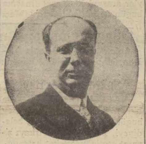
Celâl B. "İzmir,"

Fırkanın nazif erkânından mürekkep olan bu encümenler öğrendiğine göre ilk iş olarak C. H. Fırkasının esaslı ve mufassal yeni bir programını hazırlıyacak