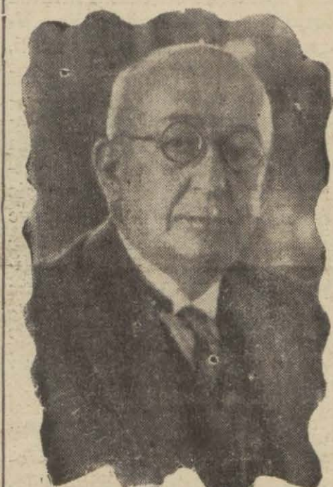
Sihhiye vekili Refik Bey

Ankara, 9 (Telefonla) — Hilâliahmerin umumî reisi sihatle İzmir felâketzedelerine yardım için giden Sihhat vekili Dr. Refik B gazetemize şu beyanatta bulunmuştur