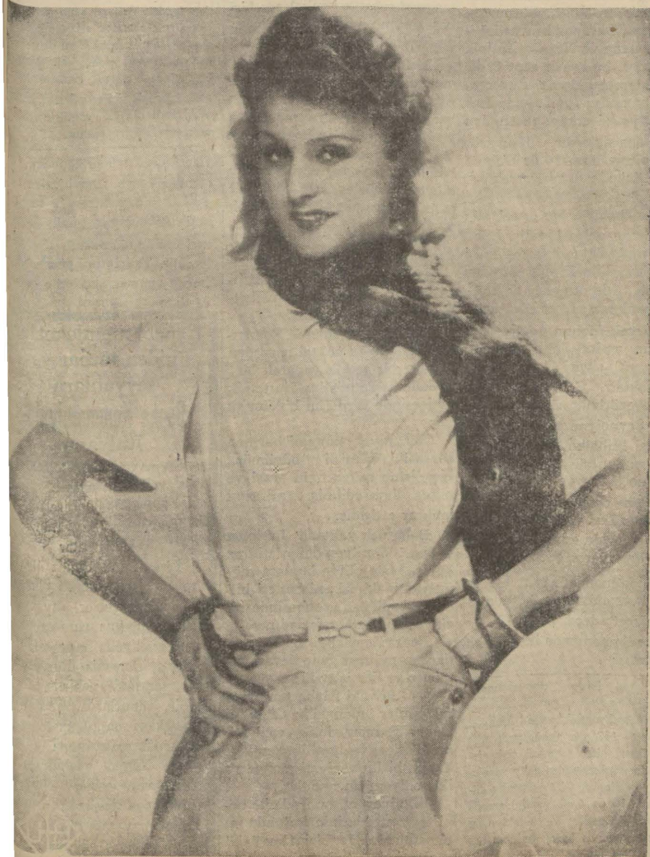
Aşk Valsi filminde n. Lilyan Haryey

Bir gün gazetecinin biri Lon Chaney ile mülakat yapmak ister. Uşağı evde olmadığını söyleyince: "Ziyarı yok, efendinize söyleyin yarın gazetemde bu günkü mülakatı okusun,, der