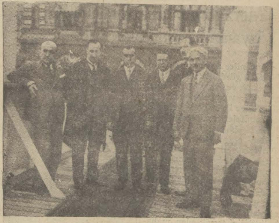
Murahhasalarımız hareket ederlerken