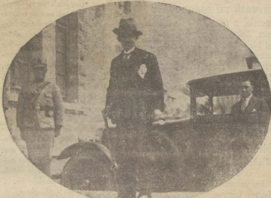
İsmet Pş. meclise giriyor

Millî müdafaa işlerinde ihtiyat ve tedbirliyiz, adli islahat muhafaza edilecek, şimendiferler siyasetine devam, işsizlikle meşgul olunacak, memurların maaşları eksilmeyecek bilâkis refahları için tedbirler alınacak, vergiler imkan dahilinde indirilecektir.