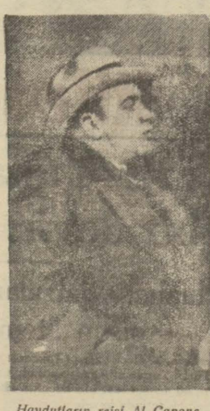
Haydutların reisi Al Capone

Amerika'nın Chicago (Şikago) haydutlarının göhretini duy mayan kalmamıştır. Bunların yaptıklarını saymak kabil değil dir. Zenginleri haraca bağlayan ve resmidevlet kuvvetlerini istihfaf eden Amerikalı haydutlar