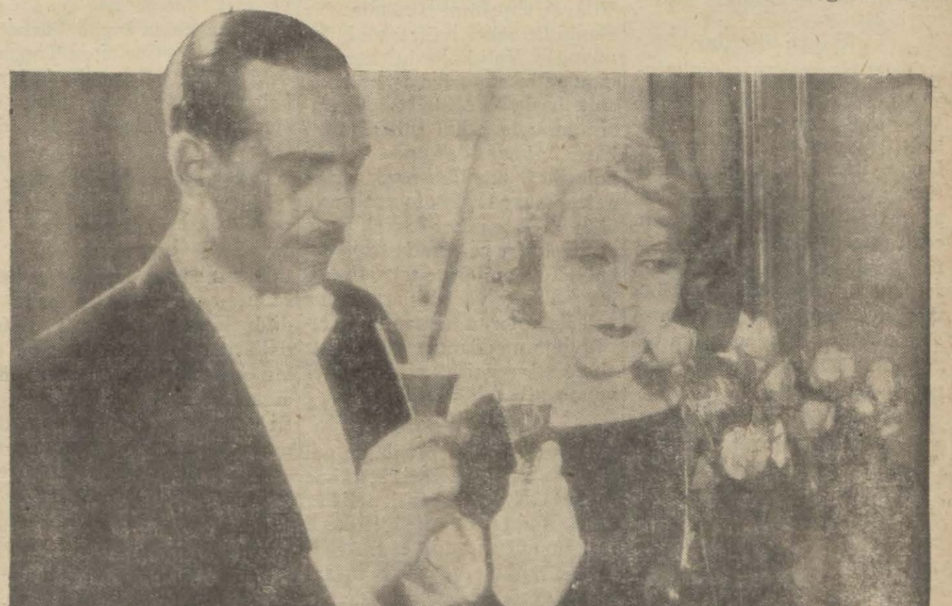
*Caz Kızı, filminden

lir. Çıkkı bir çene hem hayvanlığı hem de hilekârlığı gösterir. İnce ve düz bir ağız zalimliğe işaretir.