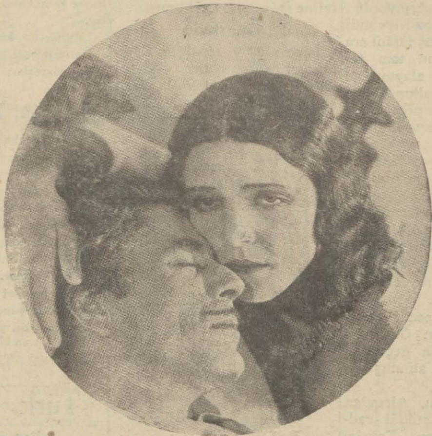
*Monelo, filminden bir sahne