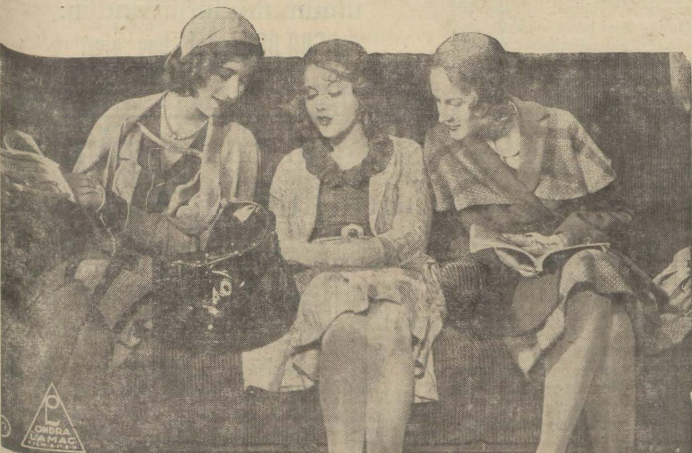
*Caz Kızı, filminden