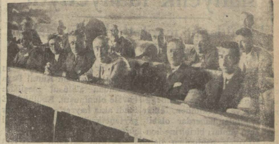
Yeni emin intihabına iştirak eden müderrislerin

Bu içtimada, son zamanlarda, bir çok kilü kali mucip olan spor meseleleri münakaşası olundu ve heyecanlı nutuklar söylendi. Bu içtima sabah saat ondan akşam yediye kadar sürdü. Neticede, Süleymaniye murahhasları tarafından verilen bir karar okundu. Bu karar, yeni federasyonlar intihap edileinceye kadar mevcut federasyonları tanımamak için İstanbul spor mntakasına salâtan istifade edeceklerdir. (Devamı 2 inci sahifede)