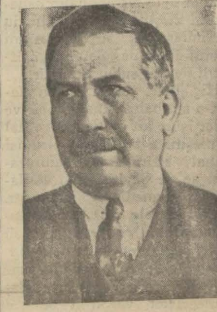
Yusuf Ziya bey

İntihap neticesinde hukuk namzedi M. Raşit B. 58 Yusuf Ziya Bey 56 reyile intihap edildiler