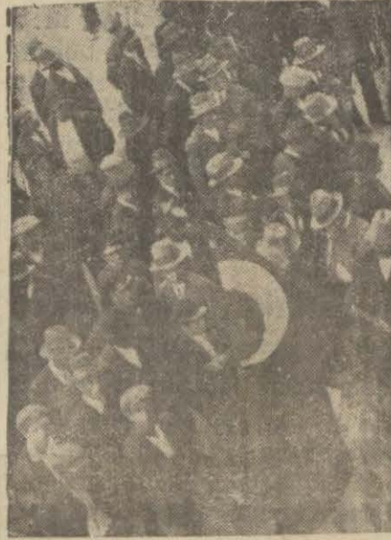
beyazıt dairesinde şehir bandosunu dinleyen grup

İntihap yerlerinin en kalabalık yeri Fatih mntakasıydı. Beyazıt dairelerinde şehir bandosu akşama kadar çaldı ve halk neşeli bir gün geçirdi.