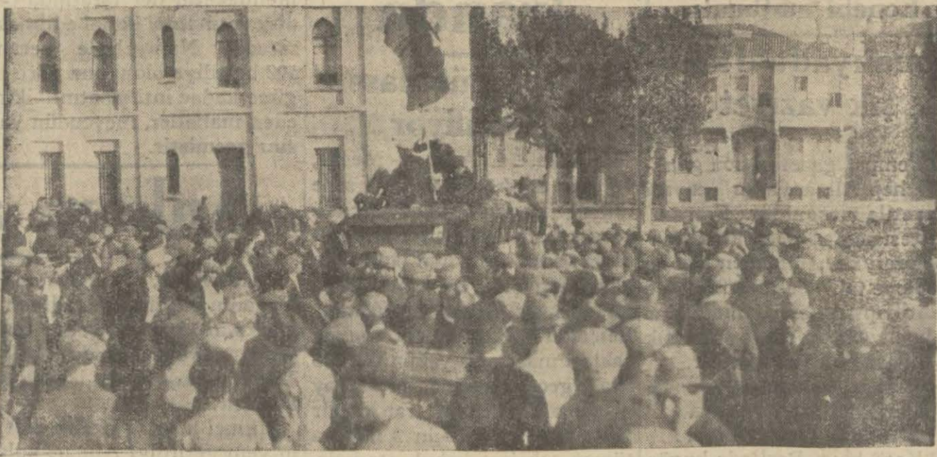
Dün Fatih kaymakamlığı önünde biriken halktan bir manzara