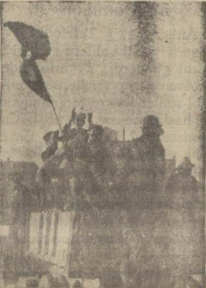
İntihap yerlerine müntahip taşıyan kamyonlardan biri

İntihabat dün cuma olmasına rağmen İstanbulun her tarafında sükûnetle cereyan etti