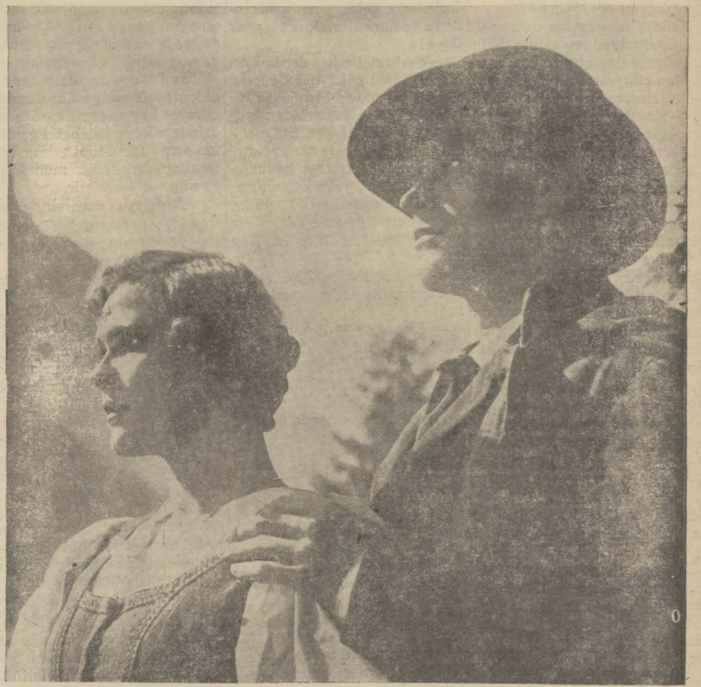
Ebedi serseri filminde Gustav Frölich ve Liyan Haid

İsminde İngilizce sözlü bir filmini geçirmektedir. Filimin fotoğrafları ve sahneleri güzeldir.