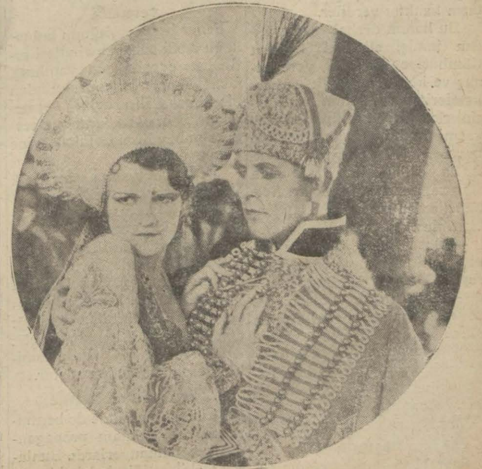
Holivud'ta bir izdivaç filminden