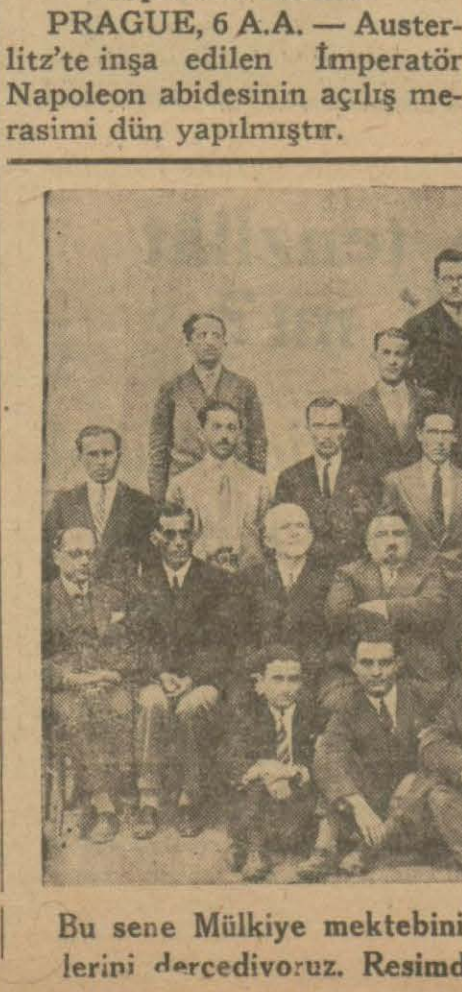
Bu sene Mülkiye mektebini bitiren gençlerimizin muallimlerle birlikte çekilen bir resim lerini dercediyoruz. Resimde görülen gençlerin hepsi yeni vazifelere tayin edilmişlerdir.

Napoleon abidesi PRAGUE, 6 A.A. — Auster litz'te inşa edilen İmperator Napoleon abidesinin açılış me rasimi dün yapılmıştır.