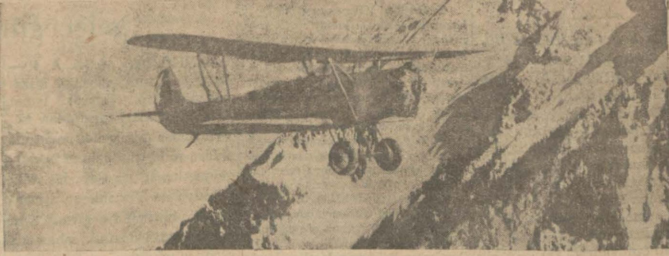
Sarp ve başları hâlâ karlı dağlara tahassus eden şakilleri tenkilat tayyarelerimizin bilhassa müessir hizmetleri görülmektedir

Cümhuriyet hükûmetinin ittihaz ettiği tedbirler, bir defa daha herhangi bir hâdisenin vukuuna meydan vermeyecek tarzda umumî ve şamildir.