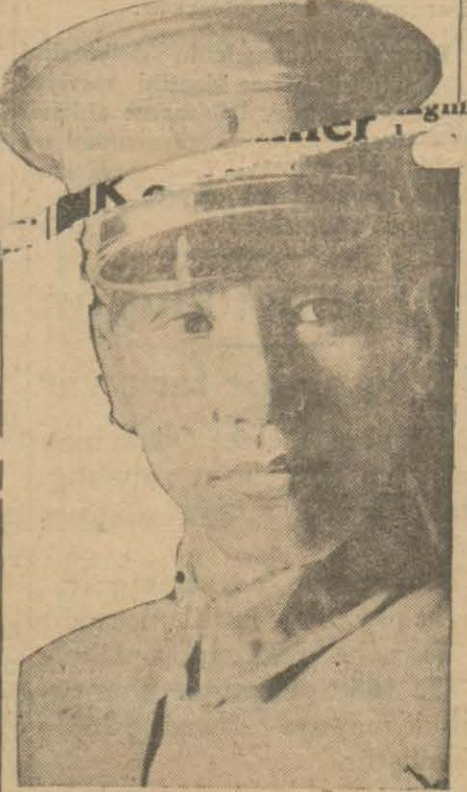
Çang Kay Çek

NEVYORK, 5 A.A. — Ala bama'daki şehirlerden birinde beyazlar ile zenciler arasında çıkan bir kavga ehemmiyetli bir arabe şekline almış, beyaz lar dan biri revolverle öldürül müştür. Bu arbedeye iştirak e denlerden 3 zenci başka bir zen cinin evine iltica etmişlerdir. Bunun üzerine beyazlar bu eve hücum etmişlerdir. İki taraftan teati edilen ateş neticesi olarak bir zenci ile bir beyaz ölmüştür. Beyazlar, bu hali görünce tehev vire gelerek evi her taraftan sarmışlar, biraz sonra ele geçi rmişler ve yakmışlardır. Evin, tüten enkazı altından iki zenci nin kömür haline gelmiş ceset leri çıkarılmıştır. Diğer bir zen ci de halk tarafından linç edil miş ve bir ağaç dalına asılmış tır. Galeyana henüz sükkün bul ma mıştır. Zencilerle beyazlar ara sında bir takım kavgalar daha oldu ğu, fakat hiç bir tarafta kan dökülmediği bildirilmek te dir.