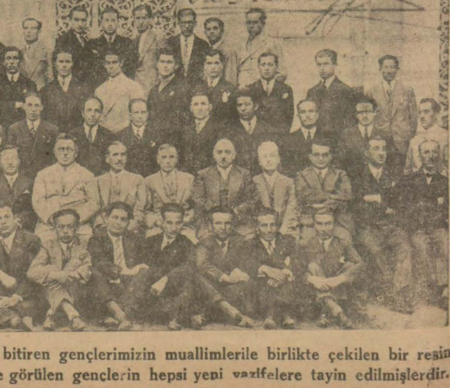
Bu sene Mülkiye mektebini bitiren gençlerimizin muallimlerle birlikte çekilen bir resim lerini dercediyoruz. Resimde görülen gençlerin hepsi yeni vazifelere tayin edilmişlerdir.

Dün Bulgar vapurı ile 60 kadar Çekoslovak talebe şehrimize gelmiş tir. Talebeler şehrimizde bir müddet kalarak müzeleri ve sayanî temâ şa yerleri gezeceklerdir.