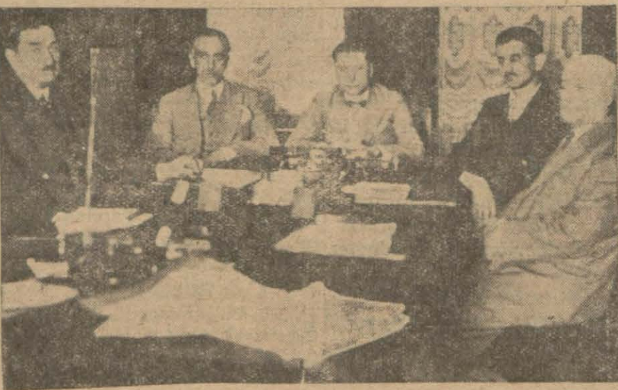
Dün sabah toplanan tarife komisyonu içtima halinde

Şark hududumuza tecavüzde bulunan haydutların esaslı bir surette tedilerine başlandığını dün haber vermiştik. Son alınan malûmata göre tenkil kuvvetlerimizin harekâtı muvaffakiyetle inkisaf etmekte, tayyarelerimizin müessir hizmetleri görülmektedir. Bilhassa sarp ve başları hâlâ karlı dağ ve uçurlara tahassus eden şakillerin tedibi için tayyare bombardımanları pek müessir neticeler vermektedir. Pek kahir ve esaslı bir tarzda başlamış olan tedip harekâtının pek yakında, bir kaç gün içinde tam ve mutlak neticesini vermesi muhakkaktır.