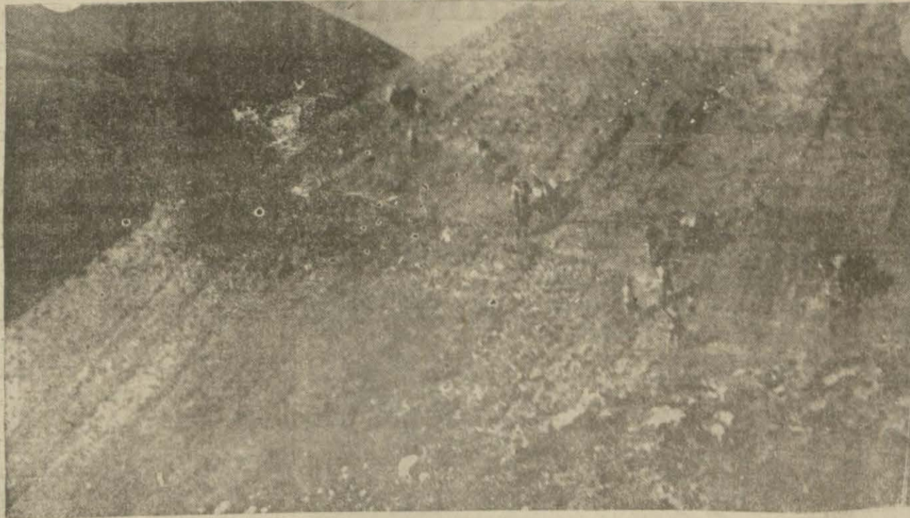
Ağrıdağı yamaçlarını tırmanan kahraman topçularımızdan bir grup