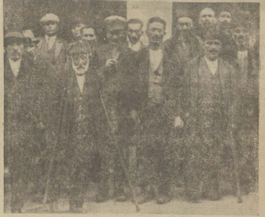
Yapılacak tevziattan istifade edecek malûllerden bir grup

Mütekaît malûllere mütebaki yüzde on iki buçukların tevziine başlanmıştır.