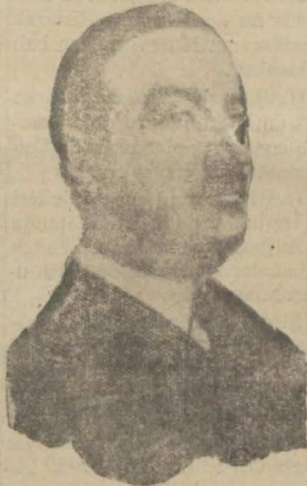
Yunan hariciye nazırı M. Mihalokopulos

Atina, 18 (Aenk)-Türkiye ve Yunanistan arasında aktı mu-karrer dostluk ve hakemlik misakı hakkında Yunanistan bir proje tanzim etmiş ve Ankaraya göndermişti. Dün Türkiye sefirisi Enis Bey Yunan hariciye nazırını ziyaretle mukabil Türk projesini tevdi etmiştir. Mükabil Türk projesi Yunan projesinde ancak bazı kelimeleri tadil etmektedir. M. Mihalokopulos Enis Beye verdiği cevapta Yunanistanın Türk projesini kabul ettiğini söylemiştir.