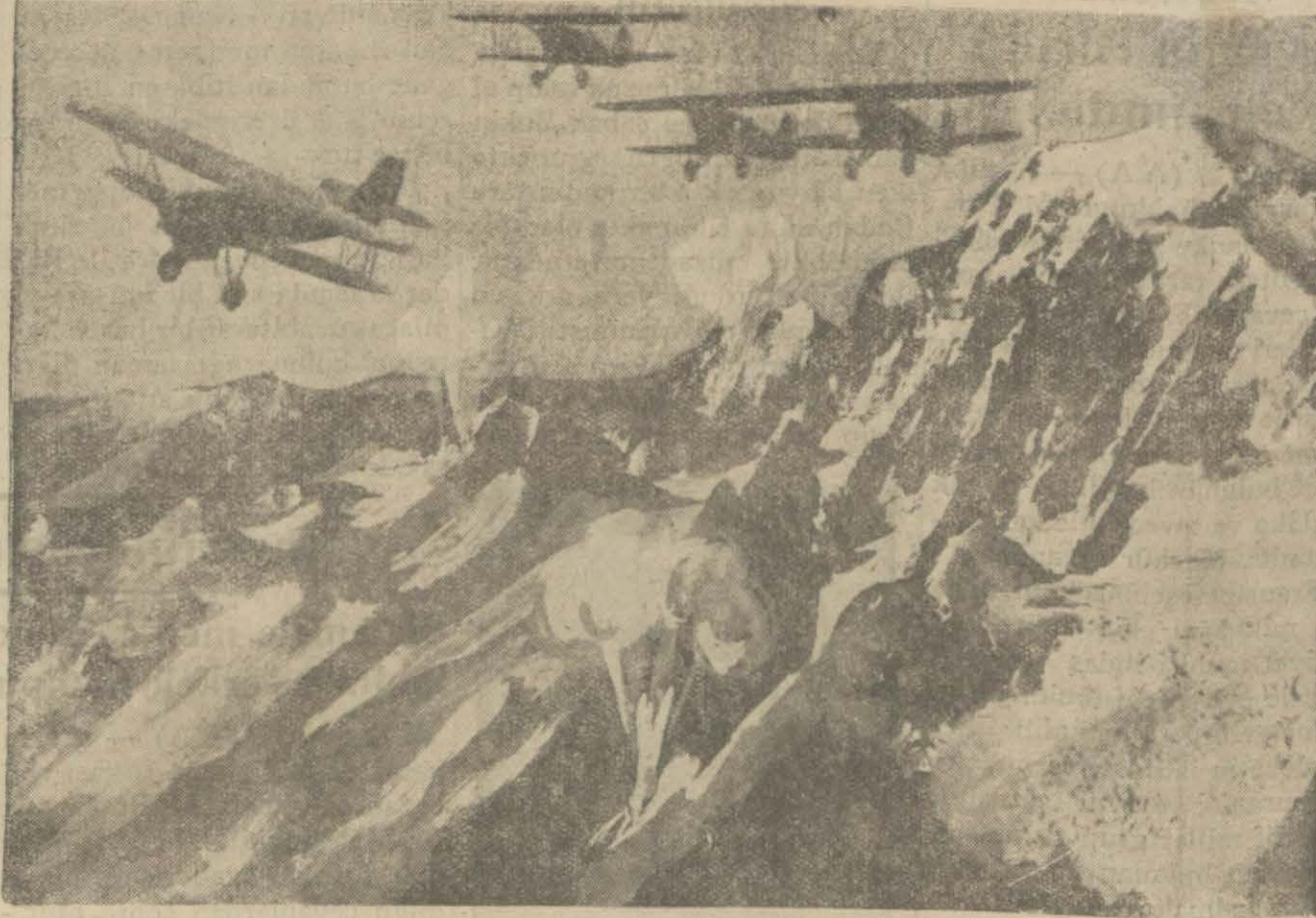
Tayyarelerimiz mütemadîyen Ağrıdağındaki şakilleri bombardıman ediyorlar