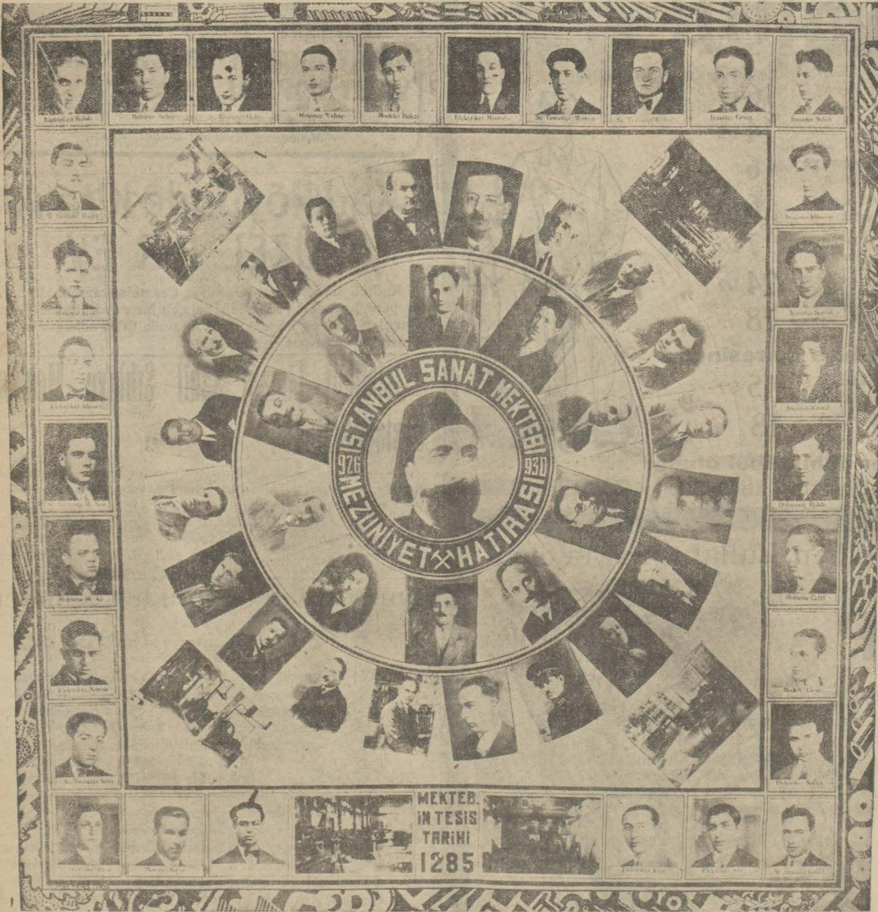
Yukarıki resim İstanbul San'at mektebi 1930 mezunlarıyla beraber heyeti talimiyasını göstermektedir. Bu resim iç dairede Atelye şefleri, dış dairede heyeti talimiyası ve bu meyanda Vali ve Maarif emini beyleri göstermektedir. Haricteki murabba çerçeve dahilinde kiler talebelere aittir. Bu sene mezun olan bu otuz efendi 7'isi elektrikçi, 6 inşaatçı, 1 dökmümlü motörcü, 2 demirli motörcü, 6 tesviyeci motörcü, 2 modelci olmak üzere muhtelif şubelere mensupturlar.