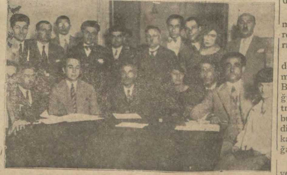
Dün dişçiler kongrelerini aktederlerken

Dişçiliği tahkir eden dişçi aleyhine dava açılarak tazminat istencek