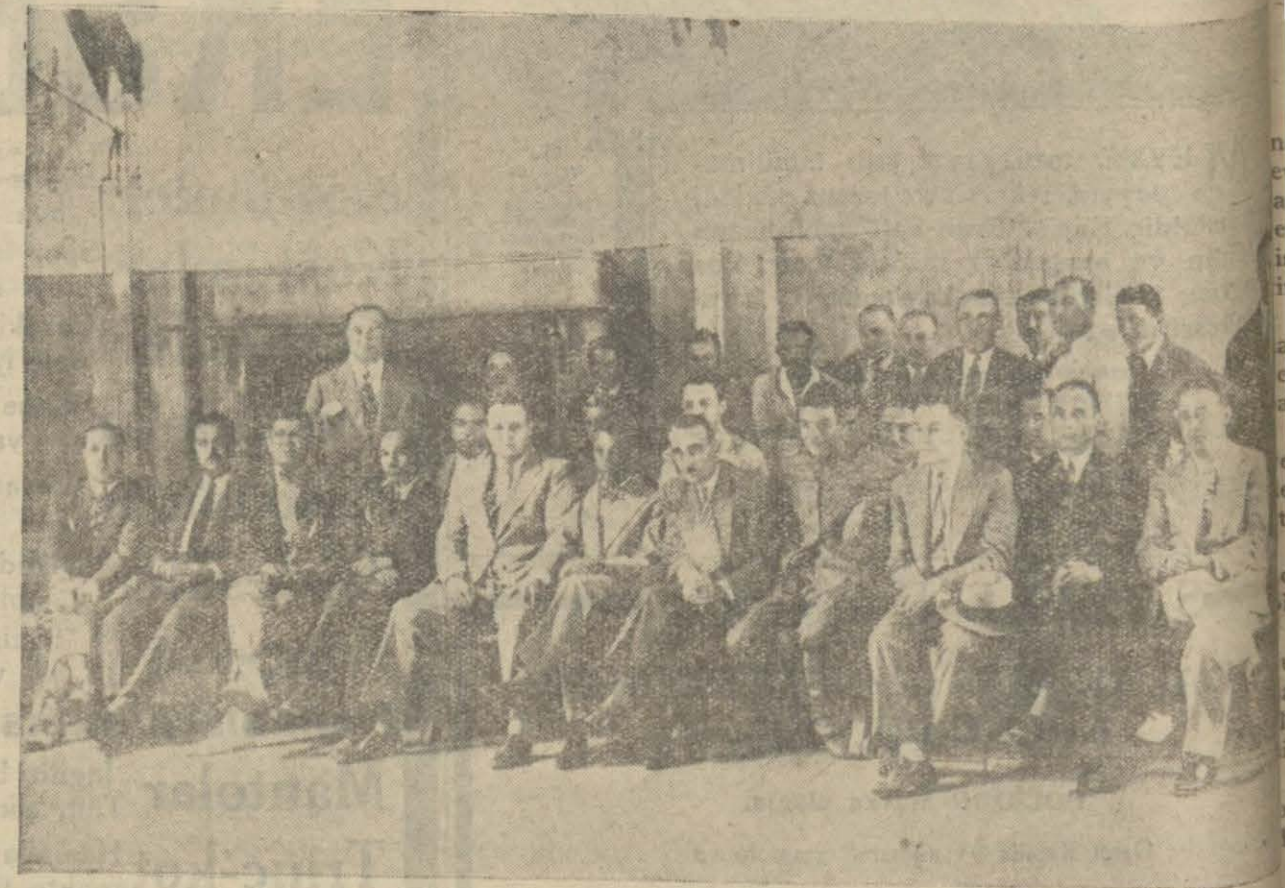
Galatasaray dün senelik kongresini aktetti. Kongrede bulunanlardan bir grnp