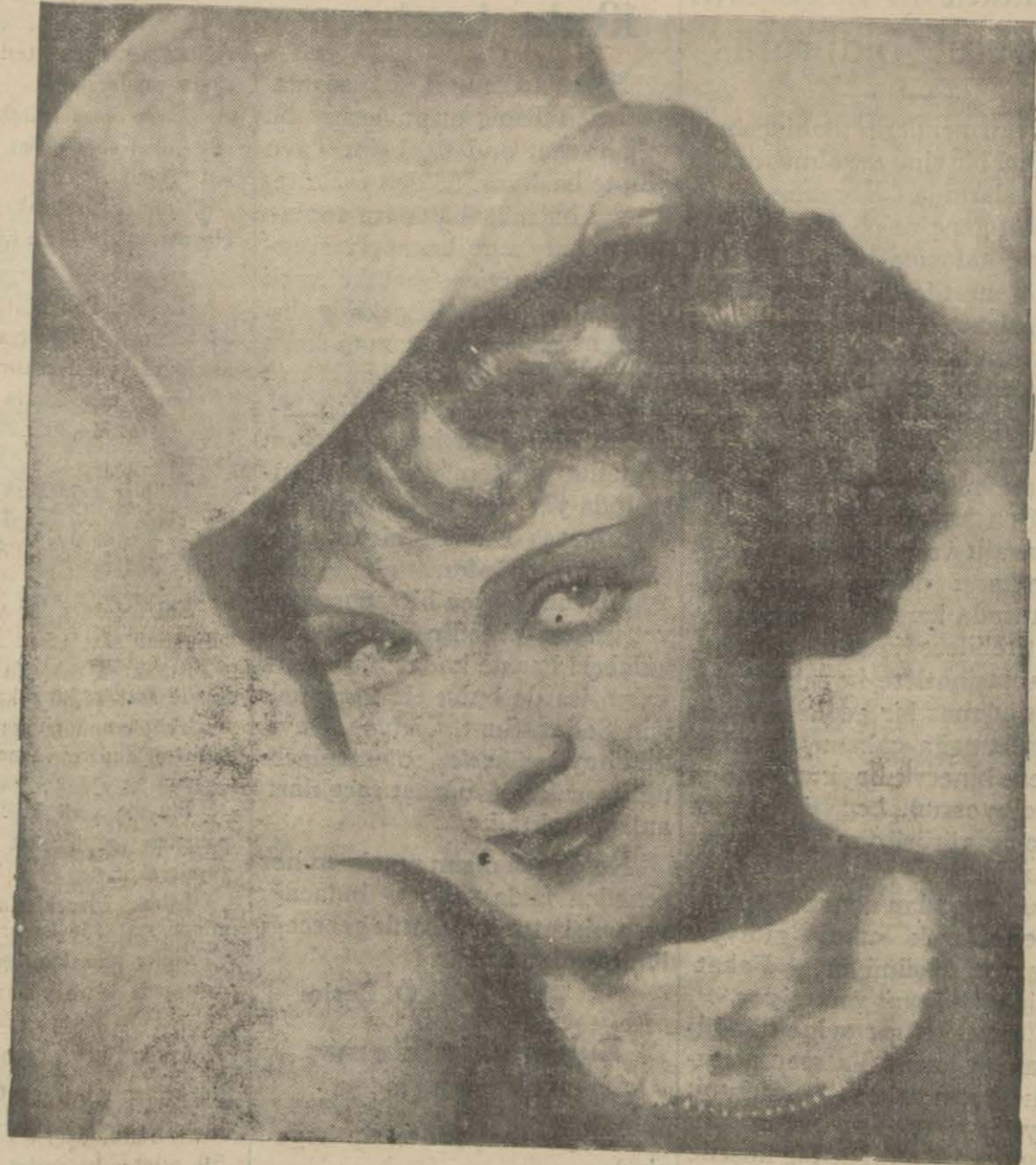
Maryen Dietrich "Mavi Melek., filminde