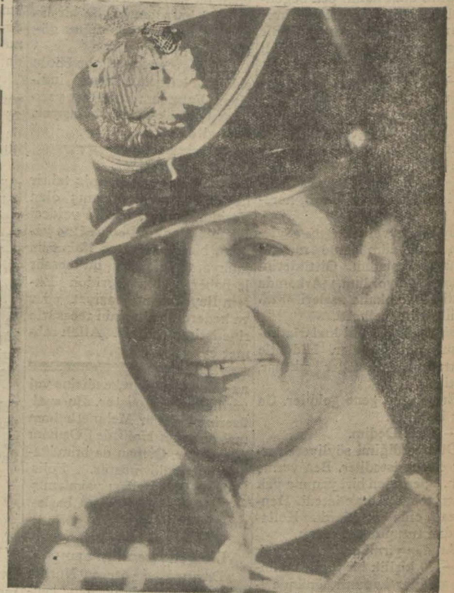
"Mavi Melek., ten sahne