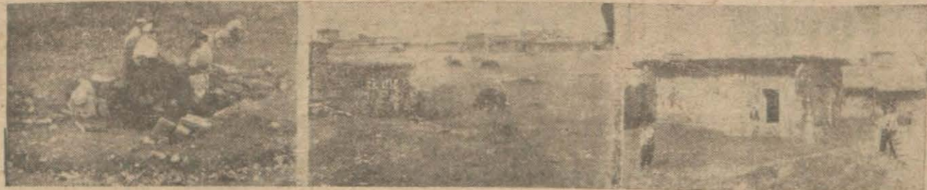
Şark muhabirimizin gönderdiği resimlerden: Çeşme başında Kürt kadınları ve iki köy