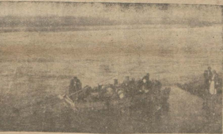
Şark muhabirimizden: Van gölünde nakliyat