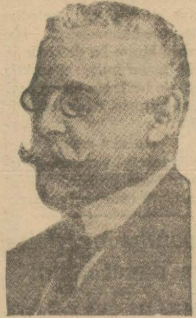
Avusturya Başvekil M. Schober

Hindistanda işsizler BOMBAY, 12 A. A. — Ecnebi emtiasına karşı ilân edilen boykot üzerine Surat'daki altın halka imalâhanesinde muntazam surette çalışmakta olan 25000 kişi işsiz kalmışlardır.