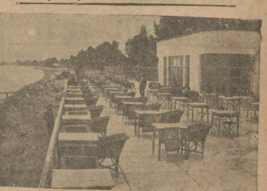
Yalova plâjı hazır..

Harp malullerine % 25 ku-ruş verilmesi lâzımgelirken % 12,5 tan verildiği ve bilâhare tamamm itası hakkında emir verildiğini yazmıştık. Sonradan verilecek % 12,5 ların bordrola-rının tanzimi bir iki güne kadar bitecektir.