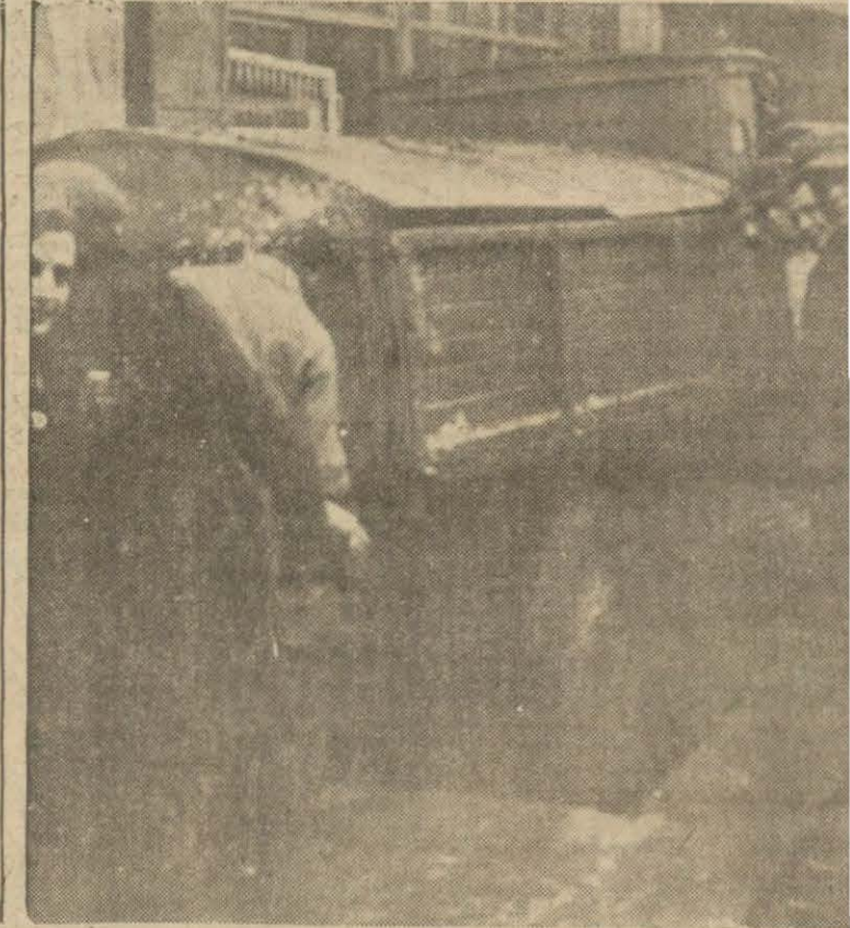
Şu resme bakınız: Koskoca eadde kâfi gelmiyermiş gibi dükkânlarla girmek istiyorlar. Dün Harîliye t rbesi görülen kamyon bir pükârı k, i i n m e l mahzen içine yu v r l n n t ş t r