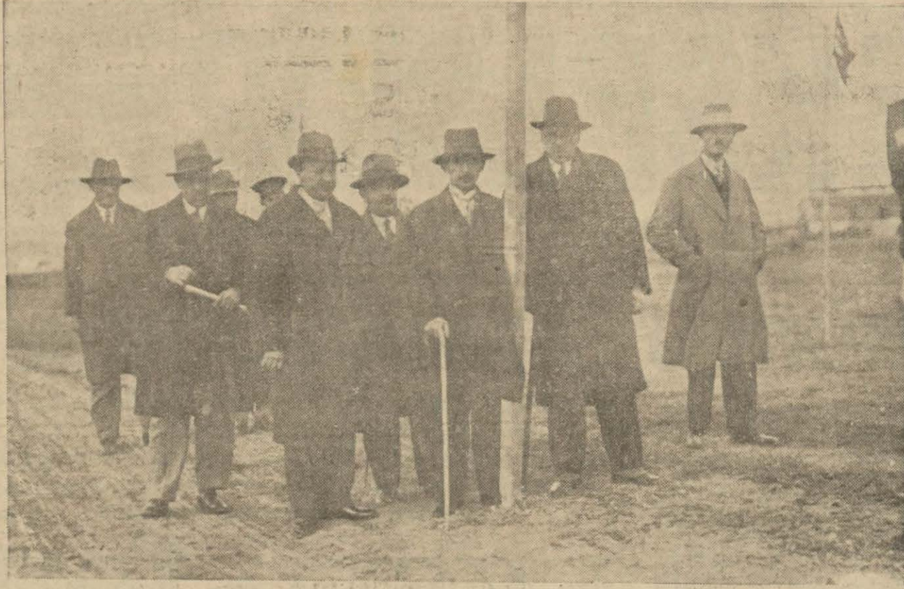
Ankara'da yeni bir koşu yeri hazırlanmaktadır. Resmimiz; İsmet Paşa ve refakatlerinde Dahilliye vekili, Ankara valisi, dahilliye müsteşarı ile birlikte koşu mahallinâ tetkik ederlerken görünmektedirler

Ticaret etmek, para kazanmak herkesin hakkıdır. Fakat bir vatandaş bu ticareti namuskârane yapmak ve vatandaşlarının her türlü zararına olarak kazanmaktan çekinmek mecburiyetinde olduğuna unutmamalıdır. Açıkta satıldığı zaman üzerine toz konacak ve böylece bir