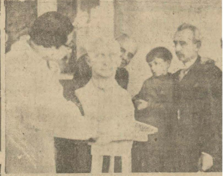
Genç Heykeltıraş Kenan Bey İsmet Paşa Hazretlerinin heykellerini yapmaktadır. Resmimizde İsmet Paşa Hazretleri heykelleri başında görülmektedir

Sütlere su katarak küçük yaşta çocukların gıdalarının azalmasına ve sıhhatlerinin bozulmasına sebep olamazdır. Bu şekilde satışlar günün birinde meydana çıkınca satan için hem mes uliyeti mucip olur. hem de