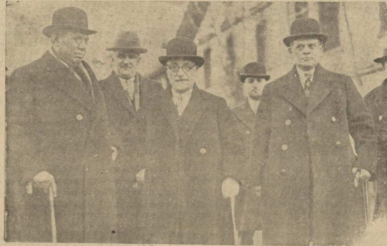
Temyiz mahkemesi birinci reisi ile Cumhuriyet baş müddet umumi ve Temyiz mahkemesi azaları Ankara'ya gelerek hakimlerli terfi listesini tanzime başlamışlardır