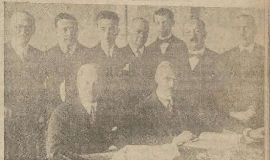
Türk - Amerika ticaret muahedesi Ankarada sefir tarafından imza edilirken

İsveç meclisi de Türkiye - İsveç ticaret muahedelerini tastik etmiştir