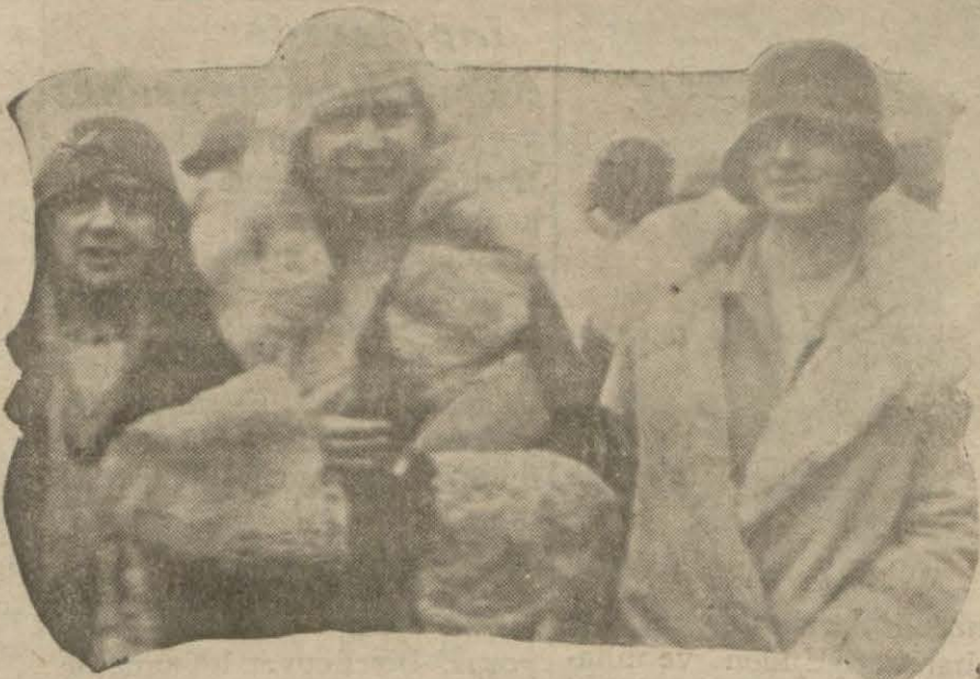
Kraliçe ve kerimesi Galata rıhtımında

Geçen günkü kardan sonra biraz düzelen hava evvelki gün akşam üzeri değişmiş, yeniden soğumuştur. Maamafih rasat merkezlerinin verdikleri malûmata nazaran kar ihtimali yoktur. Kandilli rasatanesinden aldığımız malûmata göre dün en çok hararet 3, en az 0,8 idi. Bugün rüzgâr poyraz esecek, hava bulutlu olacaktır.