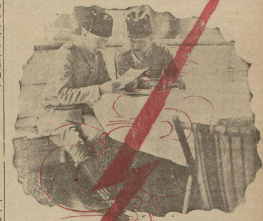
Başkumandan Vekill Enver Paşa Saraykate'ye gidiyor..

Çürüksulu Mahmut Paşa Karaköy köprüsünü ortasında geriye dönüyor. Dahiliye Nazırının yanına gelip heyecan ve telâşa soruyor.