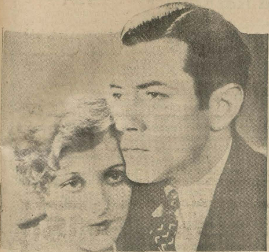
Yeni bakireler filminden