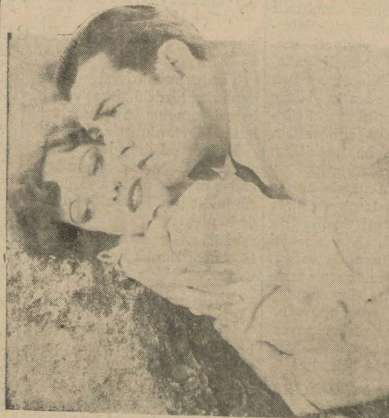
Yeni bakireler filminden

Bu koleksiyonda filmlerden alınmış 15000 foto ve 500 afiş vardır.