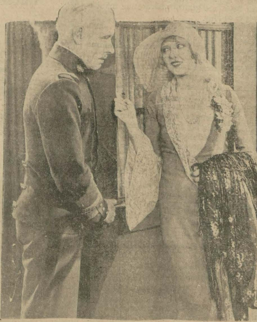
Vatansızlar cehennemi filminden

* Boksör Shmeling ve kadın,, filminde her caka hem de söyliyec