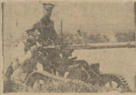
Tanklara karşı kullanılan tank toplarına faik

İngiliz ordusunun son yaptığı manevralar, umumî harpten sonra ordular için ne gibi yeni vesait temin edildiğini göstermiştir. İngilizlerin bu günkü vesait tibarile ordularını maki-neleştirme için çalıştıkları görülmüştür.