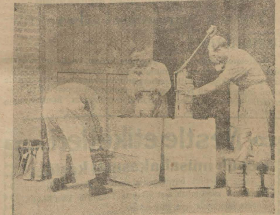
Zehirli gazı şişelere doldurma ameliyesi. Humzu karbona karşı ancak dışarıdaki havayı tenneffüs ettirmiyen oksijen depolu maskeler kullanılır.

Cihan harbinden evvel harp hukuk kitapları su kuyularını zehirlemeği büyük bir vahşilik telâkki eder ve reddeylerdi. Şimdi ise havayı zehirlemek mu bah oldu. İstikbalde, belki bita-