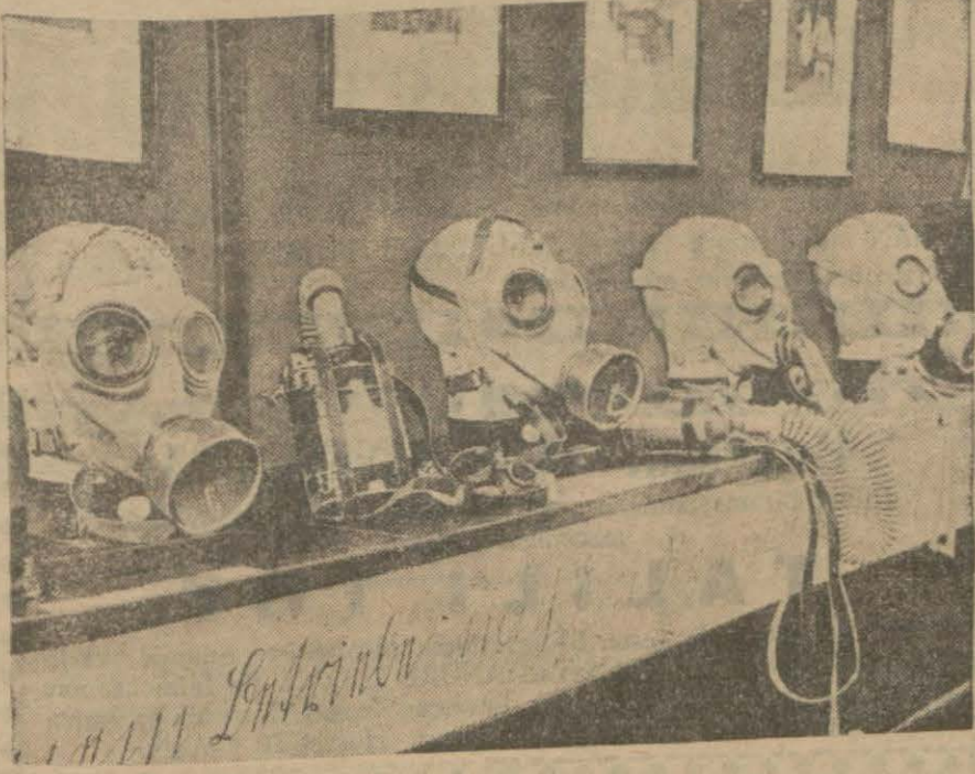
Berlinde 1929 da sergide teşhir edilen gaz maskeleri

Zengin milletler yalnız orduları için değil, bütün millet için maske hazırlamak istiyorlar