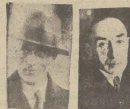
Hâmit Bey Şerif Bey

Vilâyet ile Emanetin tevdi Eylüde yapılacak. Bu beddülü teşkilât dolayısıyla büyük ve küçük memurlar arasında bazı değişiklikler olacak ve bazı makamlar da lâğvedilecektir.