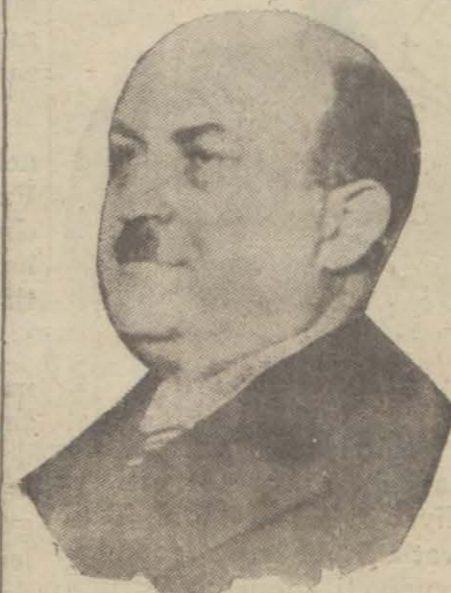
Bir şoför tarafından aleyhine darp davası açılan Muhiddin Bey

Taksim taksisine mensup şoförlerden biri tarafından Vali Muhiddin B. aleyhine darp ve tahkir davası açılmıştır. Şoför Muhittin B. den 2 bin lira da maddî tazminat istemektedir. Davaya bakan Beyoğlu ikinci