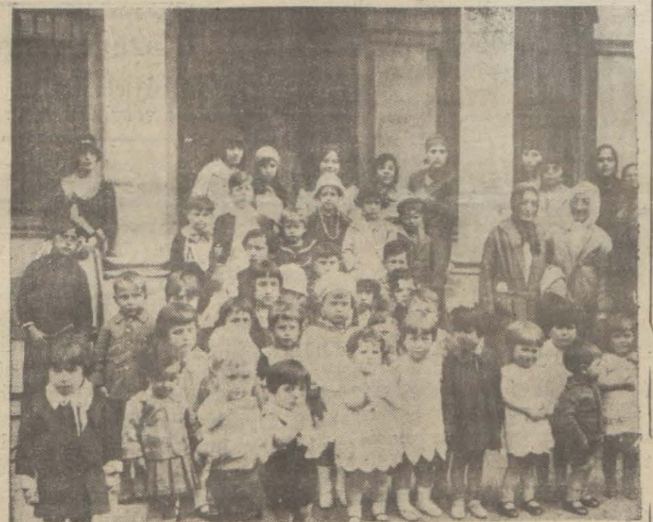
Müsabakaya iştirak eden yavrular grup halinde

Şayet bitaraflar bu hususta bir rey beyanından istinkâf ederlerse o zaman iki hükümetten birinin diğerine ödeyeceği farkı emlak için başka bir çare hal aranacaktır. Yunan hükümetinin bu kararı itihaz etmesinde muhacirin mahafilinde mahsup aleyhinde teressüm eden muhalefetin büyük dahil olmasıdır. Bu vaziyet üzerine Türk Yunan müzakeratı sürüncemede kalacak ve yeni bir buhran geçirecektir.