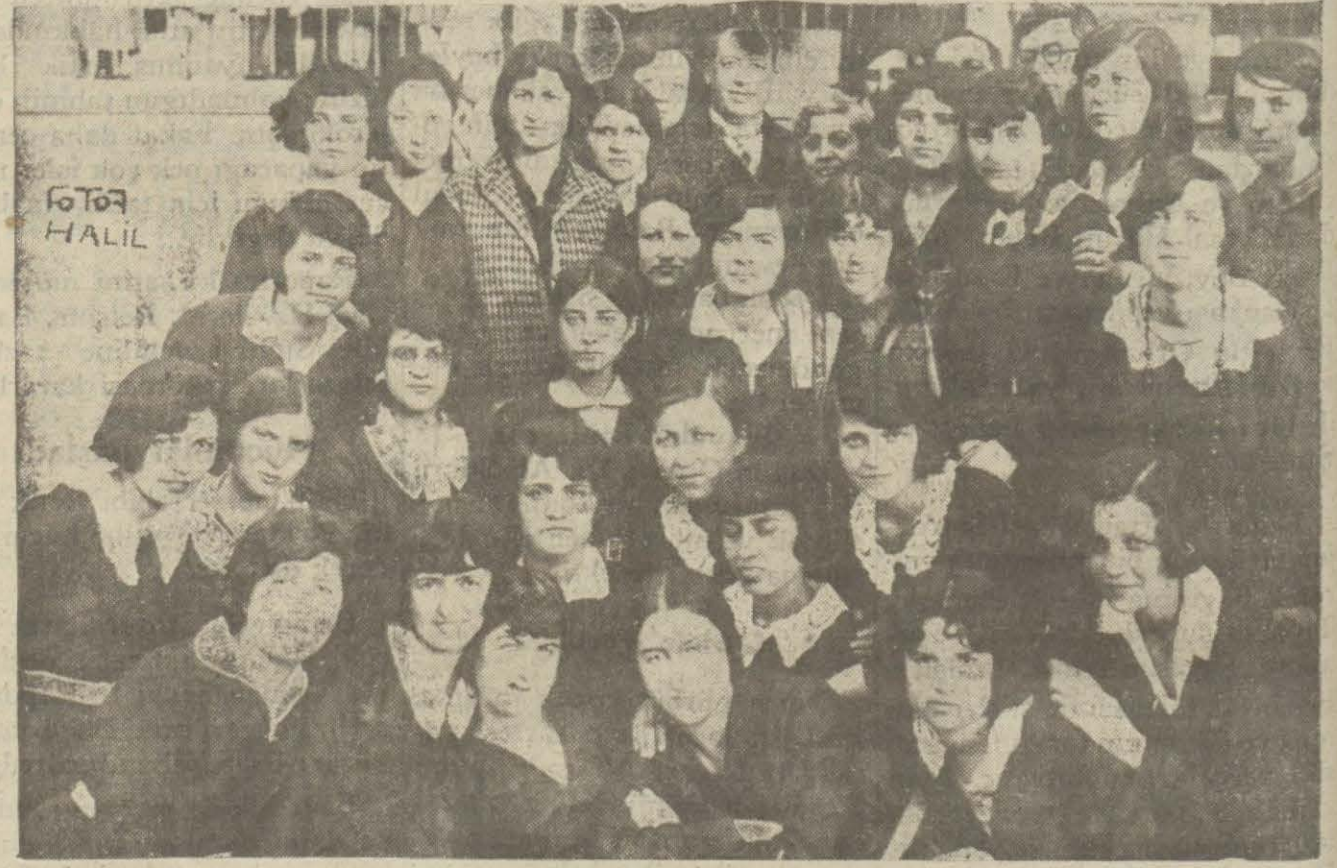
Dün İstanbul kız lisesinde mezun olacak hanımlar tarafından senelik veda müsameresi verilmiş ve pek parlak olmuştur. Müsamerede Bolu mebu'su Cevat Abbas Boyle Maarif emini muavini ve sair zevat bulunmuşlardır.