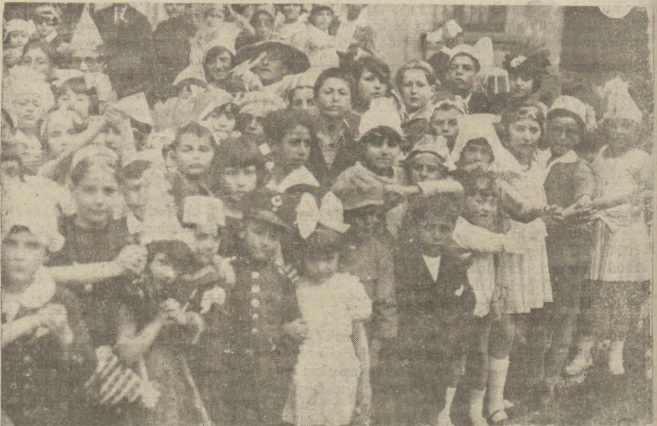
Türk ocağında dün verilen çocuk balosunda bir intiba. Küçükler grup halinde.

İSTANBUL VİLAYETİ DEFTERDARLIK İLÂNATI KİRALIK EV Adalar Malmüdürlüğünden: No 127 Yalı caddesi H. ybeliada: alt kat odun kömürlük, birinci kat bir sofa, iki oda bir taş döşemeli ufak sofa haricen mutfak vasi bahçe, ikinci kat dört oda bir sofa üzeri ve etrafı kapalı bir darıca, üçüncü kat dört oda bir sofa bir halâ geniş balkon ayrıca bir oda bir mabnah evin ön tarafı Yalı caddesine ve şimale nazırdır. Fevkalâde nezareti vardır. tahmin edilen bedelli icarı her ay peşin alınmak üzere 550 liradır icar muamelesi 4 Mayıs 930 pazar günü saat on dörtte Adalar Malmüdürlüğünde aleni müzayede ile yapılacaktır. R