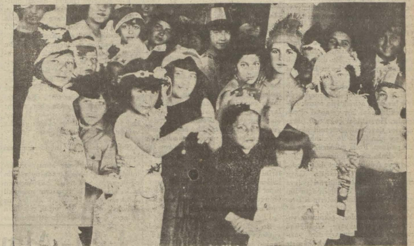
Çocuk balosunda danseden yavrular

Muhterem reis Beyefendi; âza beyefendiler. Hâkim çağırınca huzuruna çıktım. Bu kanunlarımızın icabı olduğu kadar Türk demokrasisinde âdettir. Hâkim çağırıldığı gün bütün icra vekilleri hey'etinin nasil bir tehâlükle, yine burada mahkeme önüne, şahadete geldiklerini hep biliriz. Hatta bunlardan birinin hakkında verilecek hüküm ve o hükümün infazını hep hatırlarız. Haksız yere, başı dara gelenler hâkime giderler; bu da Cümhuriyet kanunlarının icabı olduğu kadar gene Türk demokrasisinde âdettir. Hafızamda yanılmıyorsam bundan epeyce bir zaman evvel Başvekîl Hazretleri de hâkime gitmiş ve bir vatandaşın dava etmişti. Hâkim davayı gördü ve o vatandaşın berasetine hükmetti. Türk hâkimlerinin tesir altında, müdahale altında kaldıklarını avaz bağranları dilerim ki bunlar birer intibah levhasıdır. (Mabadi üçüncü sahifede)