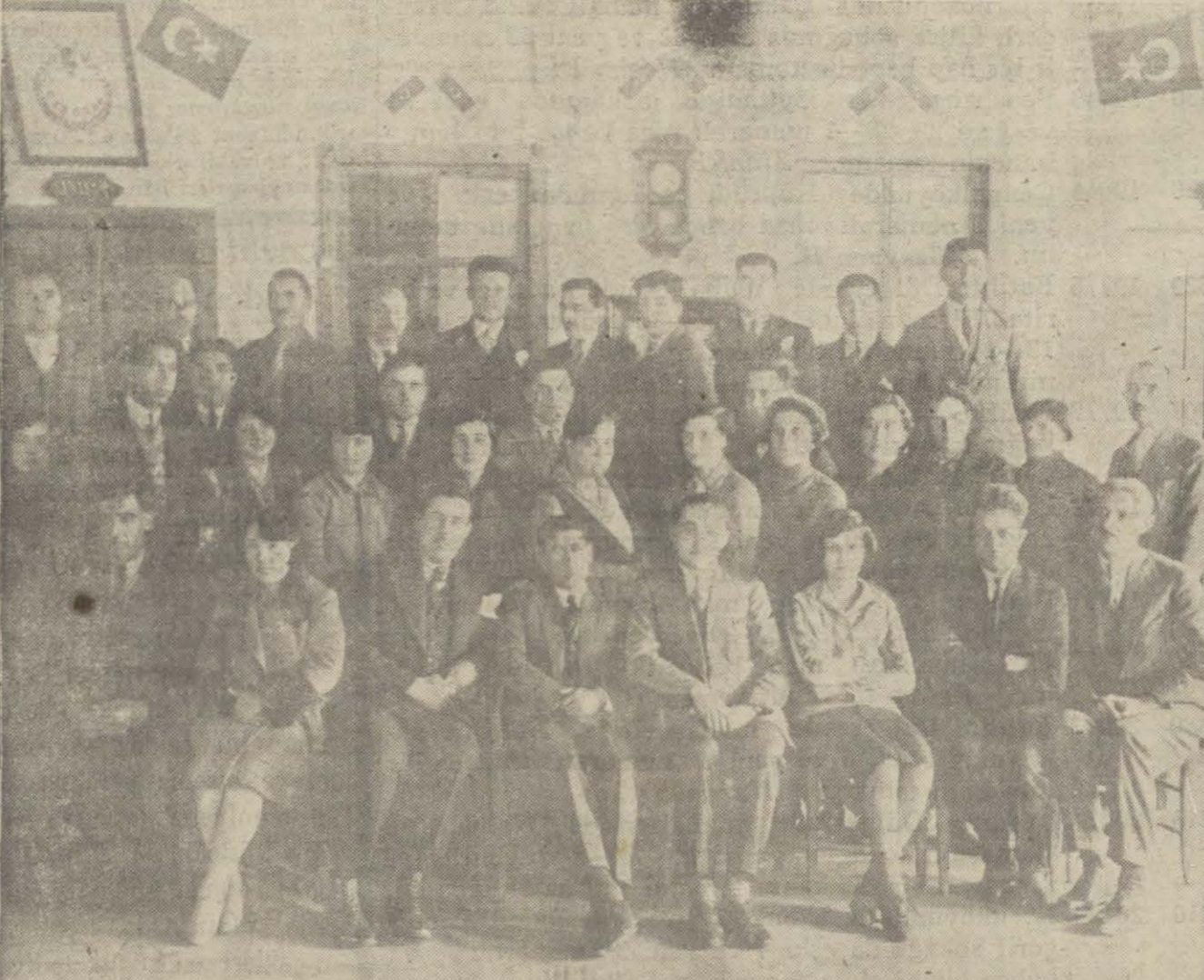
Edremit muallimleri birlik teşkil etmişlerdir. Resmimiz birlik azasını bir arada göstermektedir.