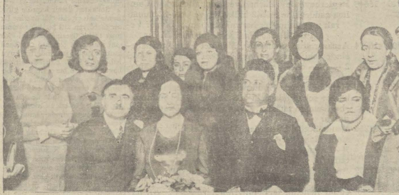
Kadınlar birliği konferansında, konservatuar talebesi tarafından da konser verilmiştir.