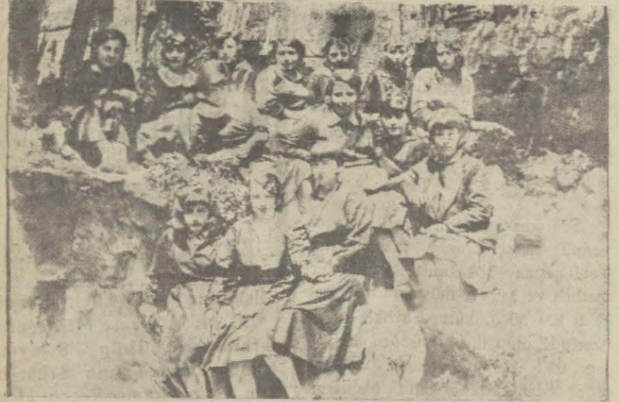
Yıziati kızı Haesi birinci devresinde bu sene 15 hanım mezun olacak