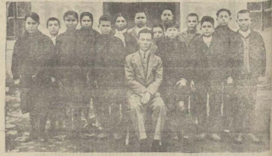
Hayrabolu ilk mektebi beşinci sınıfta ebese muallimlerle birlik