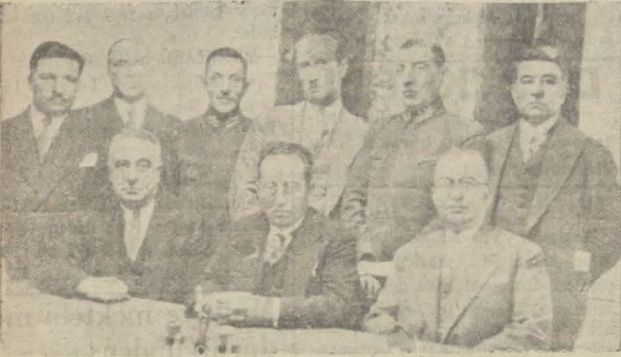
Ankara Eubba odası divanı kâsiyeti