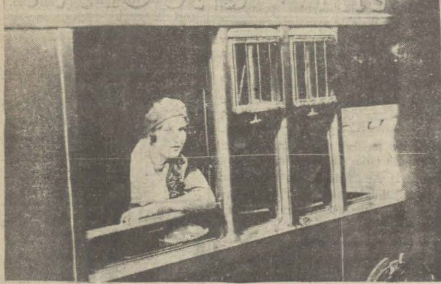
Ütün Fransız artisti Moll Mari Belle Paris'e hareket etmiştir