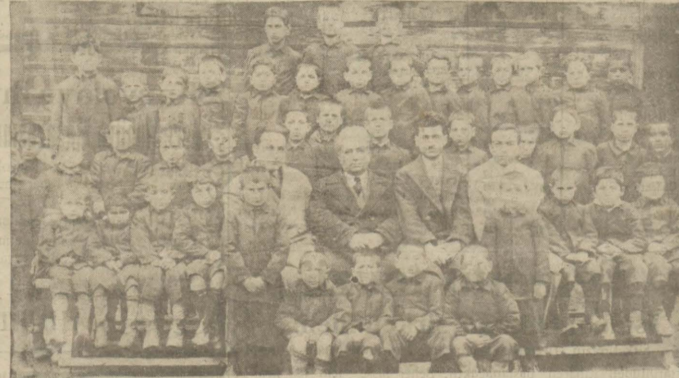
Bu resimde gördüğünüz yavrular Bafra himayeetfai cemiyeti tarafından üsba ve işe edilen çocuklardır.