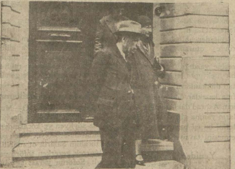
G. Mübadiller komisyonundan çıkarken