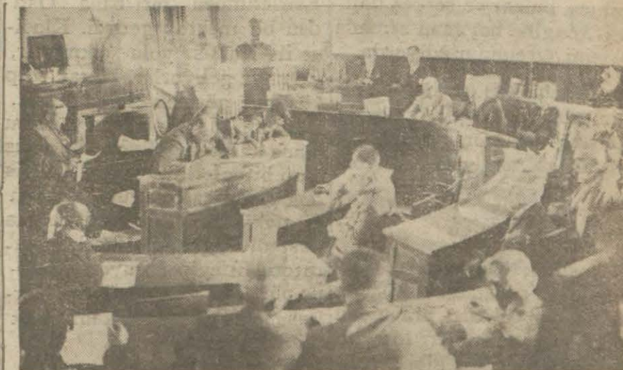
Cemiyeti belediye içtimalarından bir manzara

Her yeni dostluğun mevcut dostluklara ancak ilâve olarak teminine çalışmak ve mevcut dostluklarımızı daima itina ile vefa göstermek ve her işimizde samimî ve açık... İşte harici çalışmaklarımızın faaliyet izleri ve muvaffakiyet sırrı bundan ibarettir.