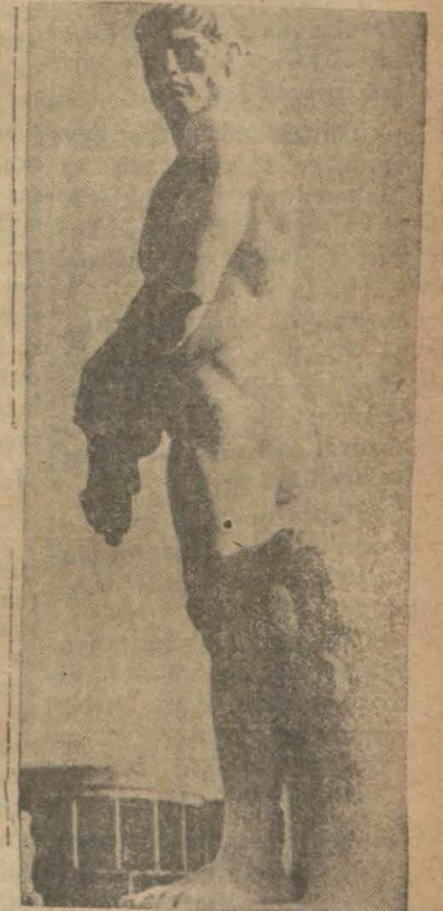
Roma'da yapılan Mussolini stadyumundaki heykellerin biri

Bu rekorların hepsi serbest yüzüşlerdir.