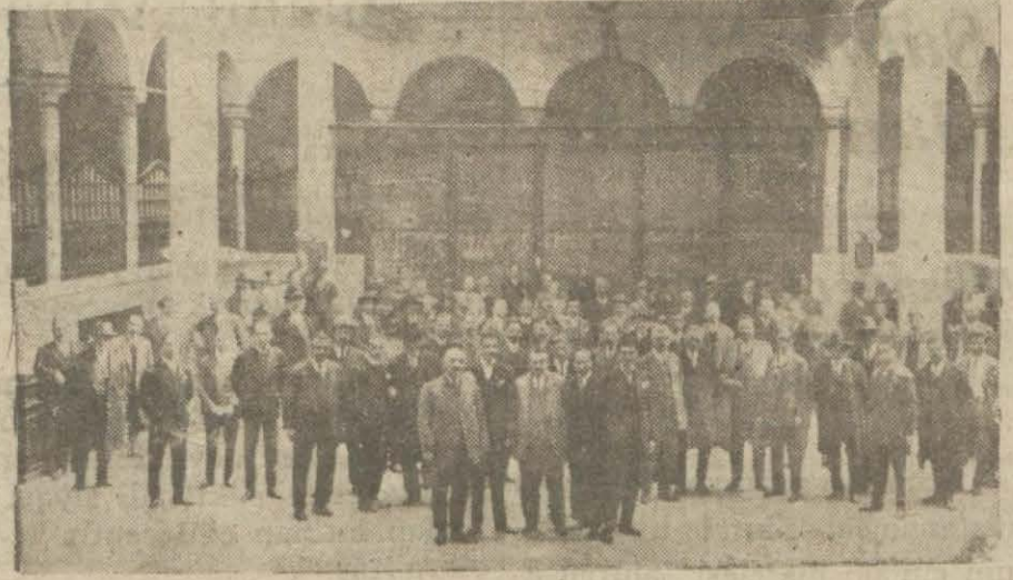
Zahire ve ticaret borsasının muamele salonu