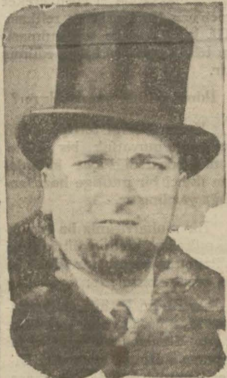
İtalya Başmurahtası M. Grandi

Londra konferansı artık son günlerini yaşıyor. Fransa - İtalya ihtilâfının halledilerek konferanstaki beş devlet arasında da bir tahdidi teslihat muahedesi akti şimdide kadar mümkün olamadı. İngiltere - Japonya - Amerika arasında bir itilâf esası takarrür etmedi değil. Lâkin Fransa ile İtalyanın bundan hariç kalmaması bilhassa İngiltereyi hiç memnun etmemiştir. Çünkü Fransa ile İtalya istedikleri gibi kendi bahri programlarına devam edecek olduktan sonra İngilterenin bir tahdidi teslihat mukavelesine bağlanmaması İngilizlerin hiç te hoş görmedikleri bir şeydir. Fakat üç devlet - Amerika, İngiltere