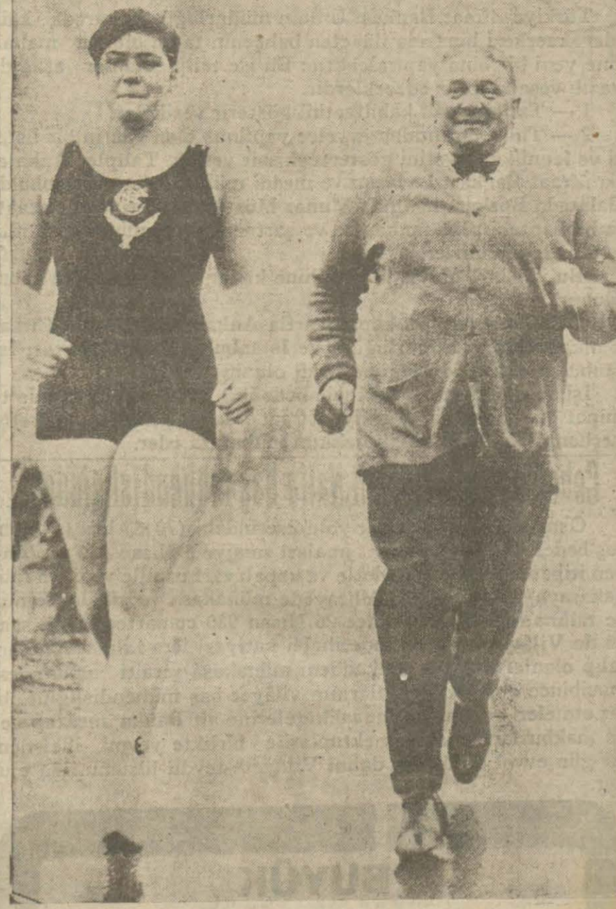
On altı yaşında Mis Patçicin Cenubi Afrikada şöhret kazanan sporcu bir kızdır. Kendisi bu sene Manş denizini yüzerek geçmeğe hazırlanıyor. Resimde sporcu genç kız yüzme hocasile beraber görüyoruz.