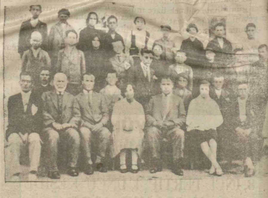
Hayraboluda ilk mektep beşinci sınıf talebesi muallimlerle birlikte