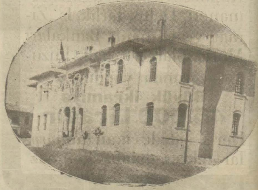
Kastamoniyeli tabii Çerkeş kazasında yeni inşa olunan hükümet konağı