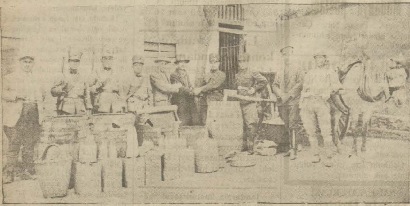
* inhisarı memurları Sökede büyük mıktyasta kaçak rakı meydana çıkarmışlar ve müsadere etmişlerdir.