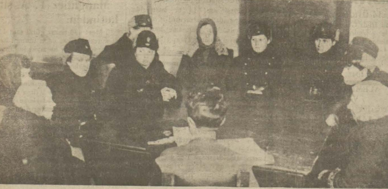
Rusyada kadınlar yalnız mob'us değil, polis te oluyorlar. Resmimiz Rusyada bir kadın polis karakolunda maznunların isticvabı esnasında alınmıştır.