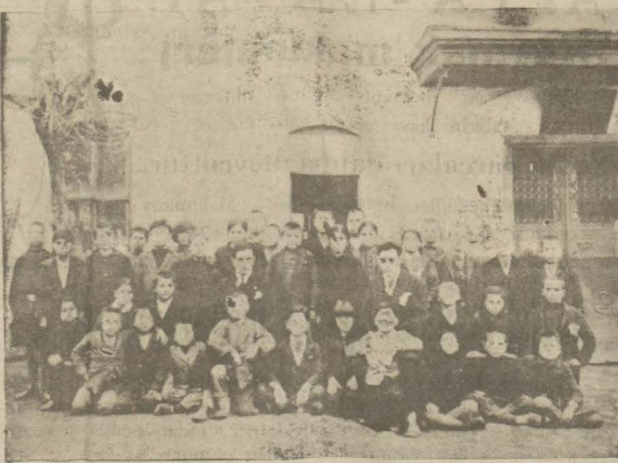
Hayraboluda ilk mektep dördüncü sınıf talebeleri muallimlerle birlikte