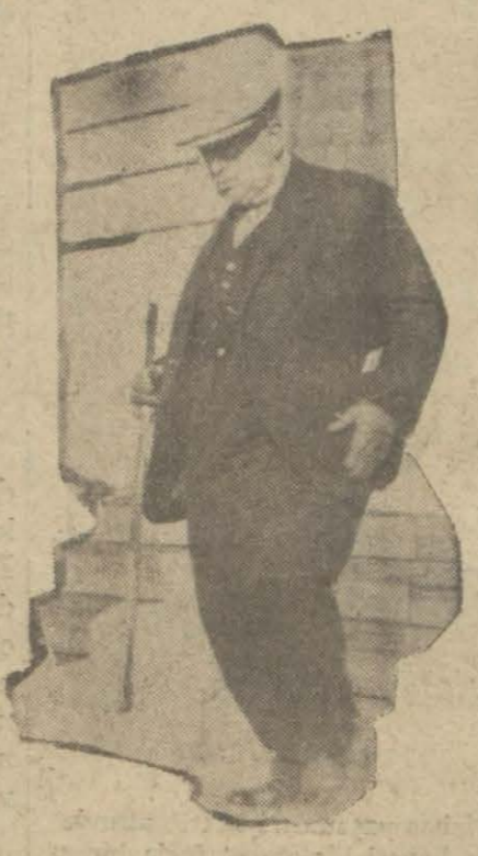
Abbas Hilmi Paş.

Sabrık Hıdiv Abbas Hilmi Paşa tarafından tesis edilmiş olan Ticaret ve Sanayi bankasının vaziyetinde mühim bir tebeddül olmuştur.