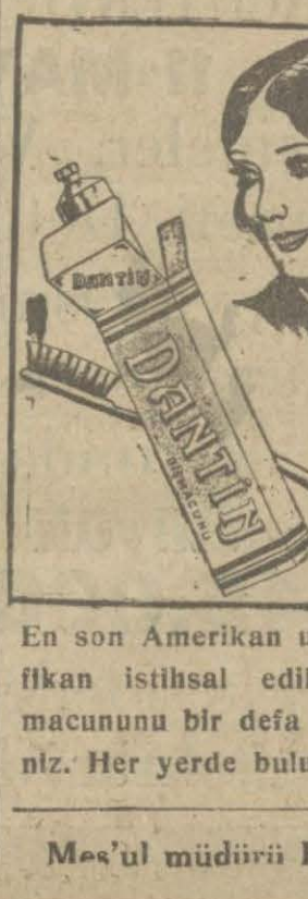
En son Amerikan t... fikan istihsal edil macununu bir defa nız. Her yerde bulu Mes'ul müdürü

Şehremanetinden: Aksaray yangın yerinde 24 adada 53 numaralı arsa-dan müfrez 956 ve 971 harita nu-maralı arsar arasında 106,58 metre murabba arsa pazarlıkla satılacaktır. Taliplerin 14 mayıs 930 çarşamba günü saat on beşe kadar levazım müdürlüğüne gelmeleri.