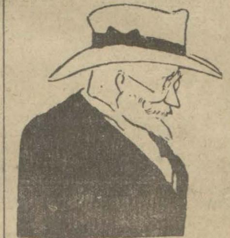
Sanki aksi olabilir miş gibi Anadolu'da gözü olmadığını söyleyen M. Venizelos

ATINA, 4 (Anek). — M. Venizelos Şikagoda müntezir De-yilinyuz muhaborine beyanatında Yunanistanın sulhperverane siyasatını izah ile Balkan devletleriyle itilâf taraftarı olduğunu söylemiş ve Sırbistanla akte dilen itilâf ve muallâk meseleleri hal için elyevm Bulgaristanla Yunanistan arasında cereyan eden müzakeratı misal olarak göstermiştir.