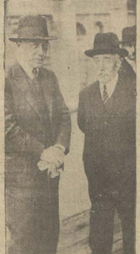
Dainler Vekilleri Ankara'da