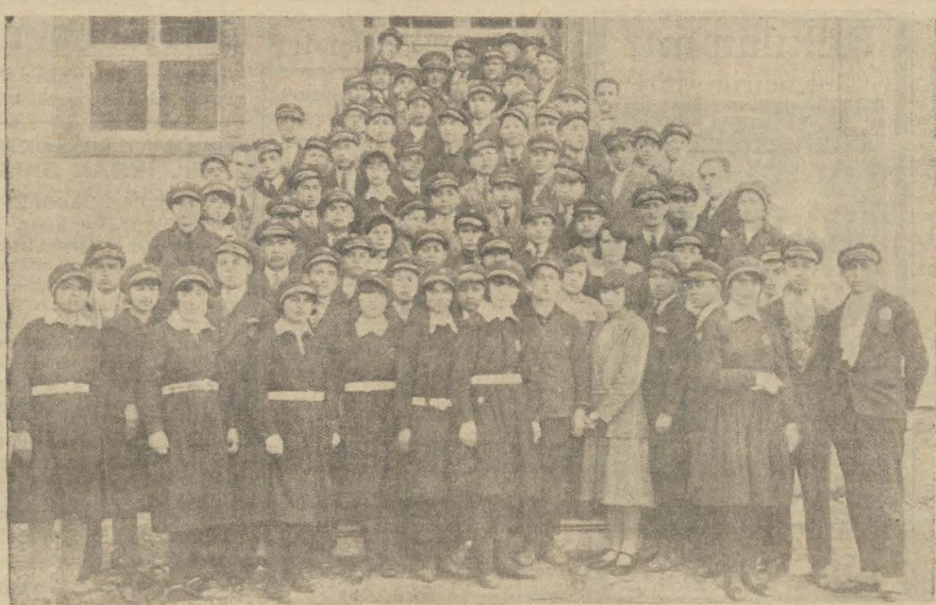
Manisa, muhtelif leyhî orta mektebi çok müfit bir müessese halini almıştır. İlim ve fen laboratuvarlarını havî olan bu mektebin tedris hey'eti ile talabının gurup halinde resimlerini dercediyoruz.

İstanbul — S. S. C. I. Türkiye Ticaret Müessilligi Ankara — " " " " " " İzmir — " " " " " " Trabzon — " " " " " " Samsun — Komisyonumuz kılıççı zade Ticarethanesi BEYOĞLUNDA SOVYET HANINDA, SOSYALİST SOVYET CUMHURİYETLERİ İTTİHADI TÜRKİYE TİCARET MÜMESSİLLİĞİ Tel. B. O. 4060