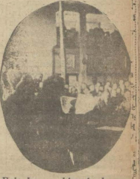
Reis kararı bizzat okuyor.