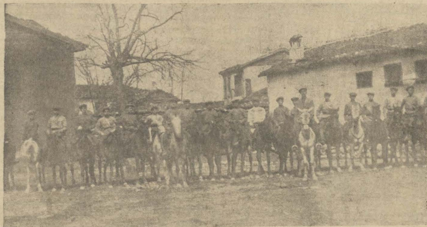
Bursada idman yurdu binicileri gurup halinde

Yelkenci vapurları Karadeniz postası Samsun vapur 21 Mayıs Çarşamba günü akşamı 6da Sirkeci rihimından hareketle doğru [Zonguldak, İnebolu, Samsun, Ordu, Giresun, Trabzon, Sürmene ve Rize] ye gidecektir. Tafsilât için Sirkeci'de Yelkencilik binasında kâin acentesine müracaat. Tel. İstanbul 1515