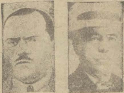
Kuran'ın tercümesinin leh vealeyhinde münakaşalarda bulunan iki millet vekili