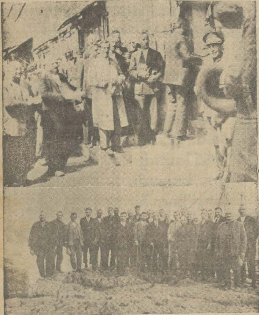
Alaplı nahiyesinin resmi kışadına ait intibalar.