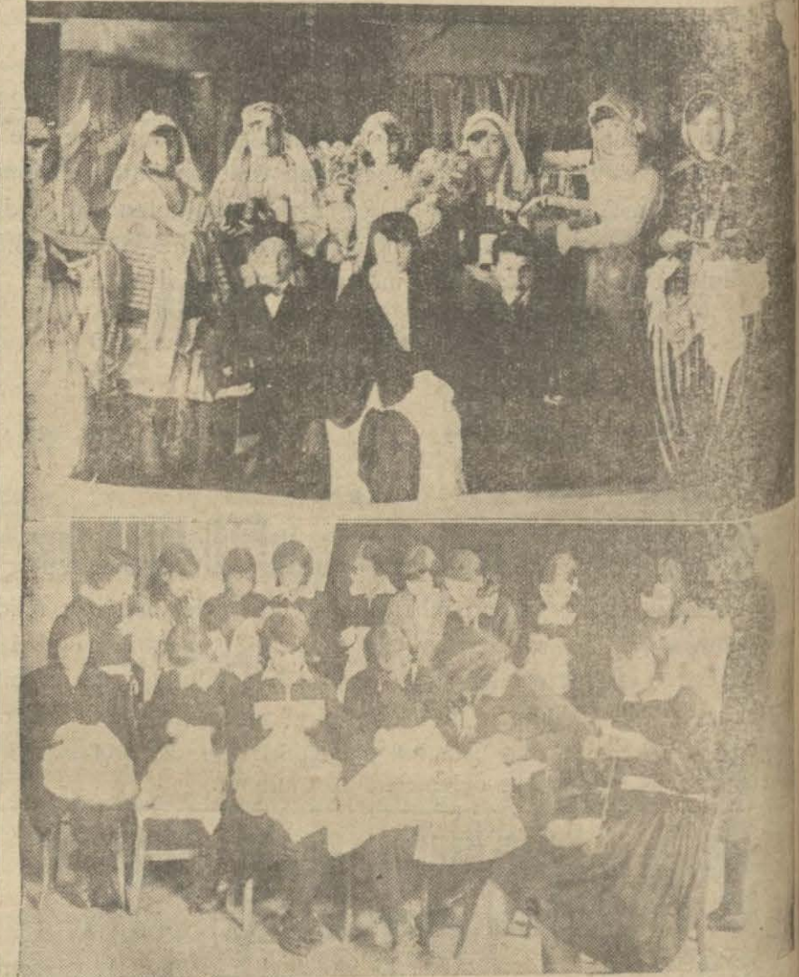
Bu resimlerde Manisa orta mektep talabesinin yerli temsilî sahnesi ile talabesinin nakış dersine çalışmaları görülmektedir.

Hindistan seferlerine tahsis edilmiş büyük ve zarif "GANGE" transatlantik vapuru istisnal bir surette LLOYD EXPRESS seferini yapacak 29 Mayıs 1930 Perşembe günü tam saat 10 da Galata rihimından hareketle Pire, Berdizl, Venedik ve Trieste'ye gidecektir. Paris ve Londra için doğru biletler. Fiiallar mutav veçhiledir.