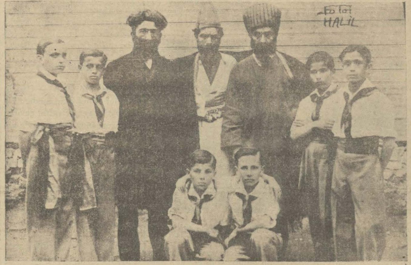
İstanbul erkek lisesinden bu sene mezun olacak yüzelli genç dün bir veda münasimesi yaptılar. Münasime samimi oldu. Resmimiz edebiyat şubesinin tertip ettiği şair tablosunda alkışlanan "Yunus Emre", Füzuli ve Namukkemal'i temsil eden efendilerle ağabeyle inin şerefine bazı numaralar yapan mektebin küçüklerini gösteriyor.