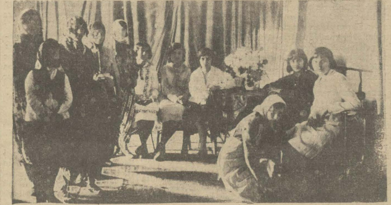
Şemsielmekâtipce verilen bir münasimede taicbe taratından temsil edilen bir piyesin son perdesi.