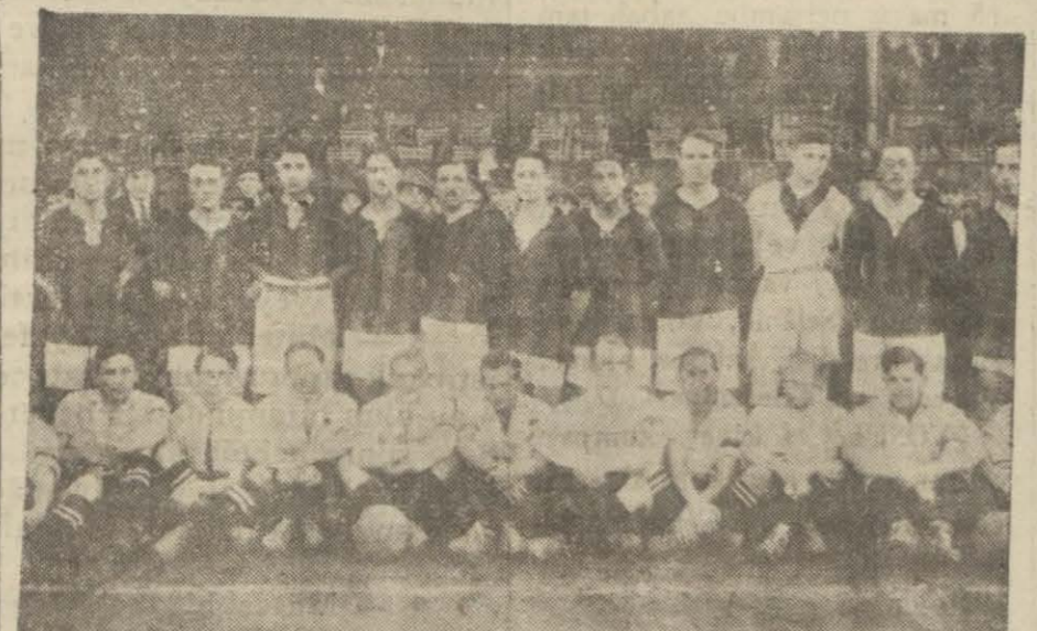
Birhatıra daha; 921 senesinde takviye edilmiş Galatasaray takımı, dört darülfünun takımı mühtelile Peşte'de 3-3 berabere kaldığı maçıdan evvel

İlk devre esnasında gerek Galatasaray ve gerek Macarların güzel hücumlarına şahit olduk. Fakat Macarların hücumu Galatasaray müdafaasının canlı ve yüksek oyunu karşısında daima akim kalıyor ve yahut