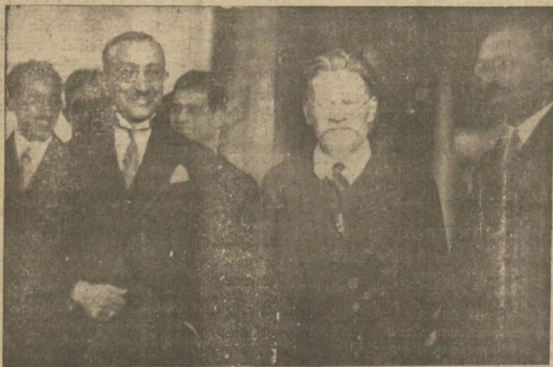
V. A. Afgan Hükümeti mühim merkezilere seffirlerini gönderdi. Ezcümle Moskova'ya da Aziz Ma. gönderilmiştir.