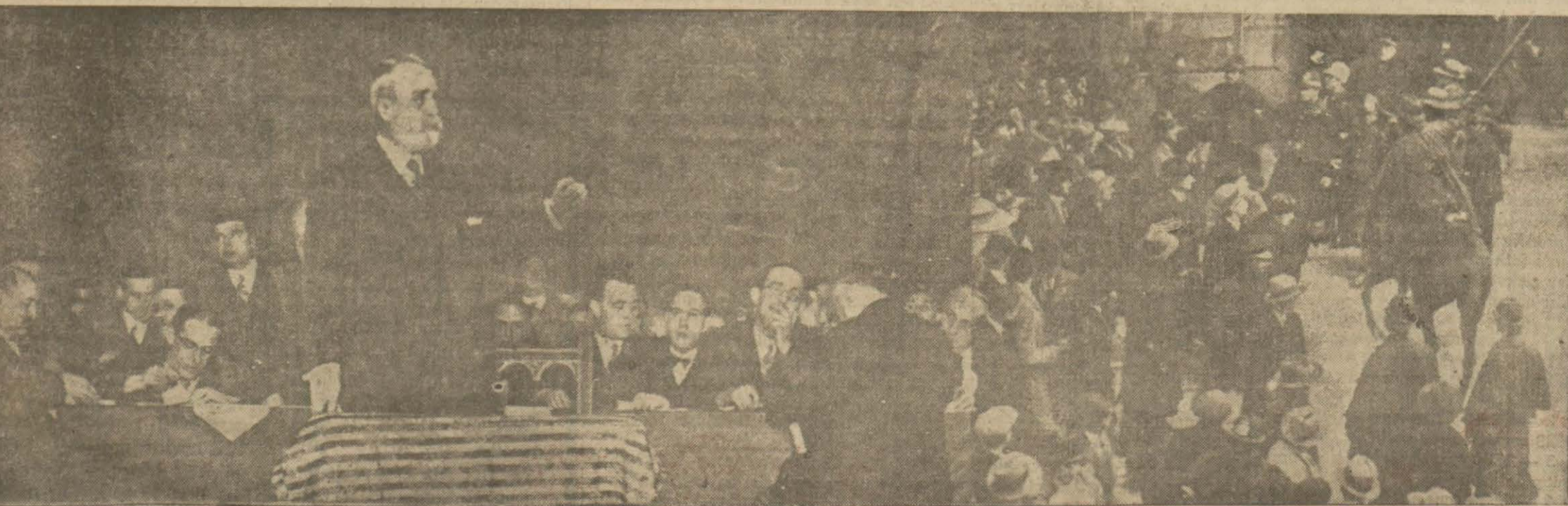
İspanyada halk cümhu. istiyor. Eşbak başvekil (Sanchez Guerra) irat ettiği barasetli bir nutukta artık bir l. s. dik kalı. amayacağını söylemiş ve herkes tarafından alkışlanıyor. resimlerimiz eşbak başvekilin nutuk irat ederken ve halkın zabita tarafınca dağılıldığını gösteriyor.