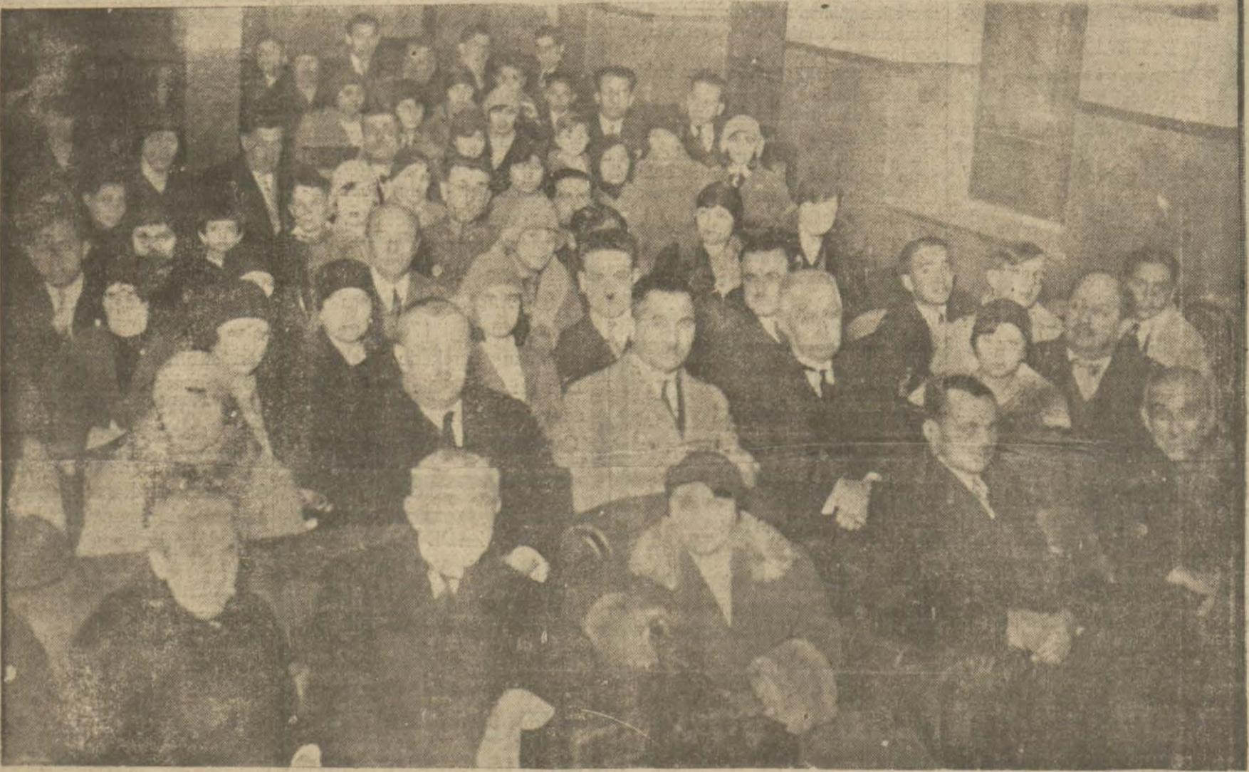
D. Darüşşefaka'nın s. elik müsameresi parlak bir surette yapılmış, danslar edilmiş, Ahmet Vefik Pa. nın Müral piyesi oynanmıştır.