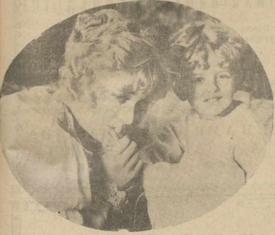
"Praterde bir gece" filminden