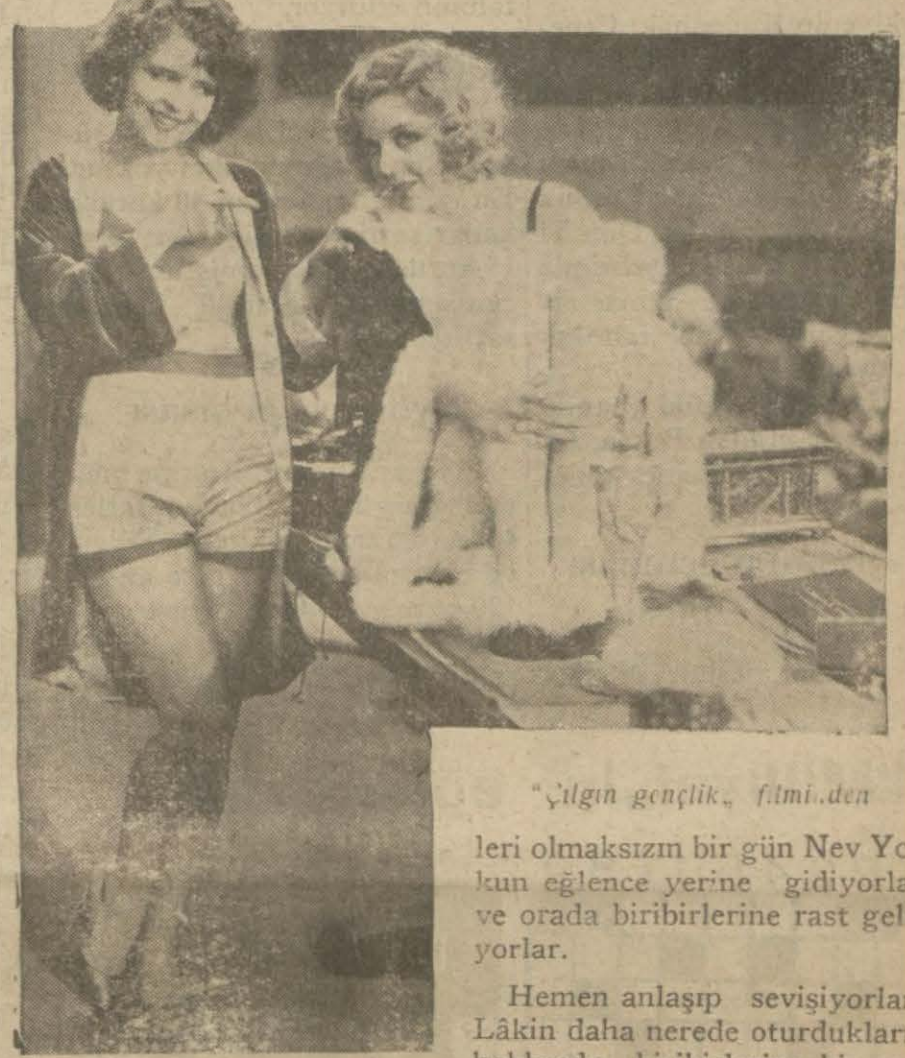
"Çılgın gençlik" filminden

leri olmaksızın bir gün Nev York'un eğlence yerine gidiyorlar ve orada birbirlerine rast geliyorlar.