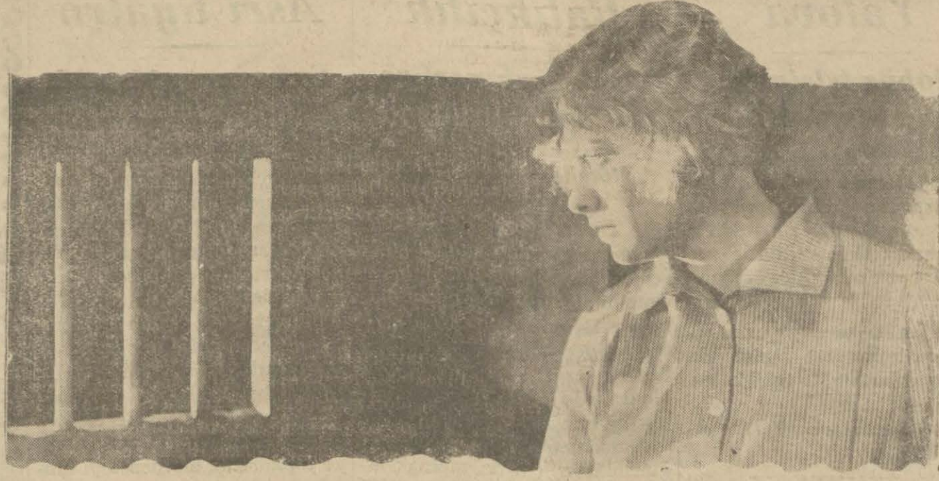
"Praterde bir gece" filminden

«Mari Gosse de Père», ismindeki film manzara kısımları ikmal edildikten sonra Adolphe Menjo Holivuda dönerek bu filmi imaline devam edecektir.