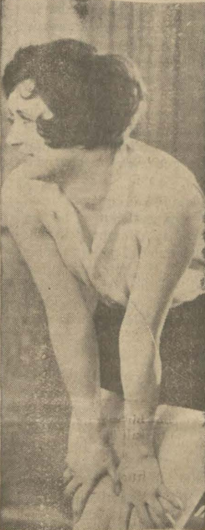
"Çılgın gençlik" filminden

Melek sineması sesli film göstermeğe başlayınca kadar elin deki sessiz filmleri göstermek istediği içindir ki artık her haf-